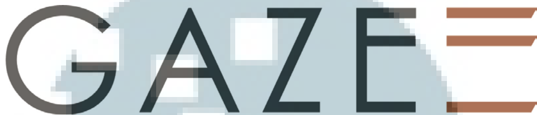
Gambar 2.1. Logo GAZE