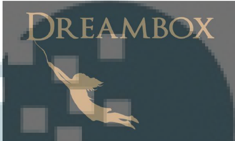
Gambar 2.1 Logo perusahaan Dreambox

tinggi profesionalitas dan pelayanan yang memuaskan, dimana kualitas sangat diutamakan. Logo Dreambox dapat dilihat pada gambar 2.1.