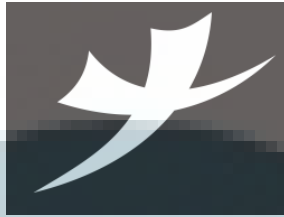
Gambar 2.4 Lambang putih pada logo

Lambang putih yang berbentuk seperti burung yang sedang terbang ke atas, berasal dari lambang kesehatan yang berbentuk +. Warna putihnya melambangkan kesucian sesuai nama “Ariya”. Lambang + yang sedang terbang melambangkan bahwa, RS. Ariya Medika terus meningkat dan berkembang kearah yang lebih baik.