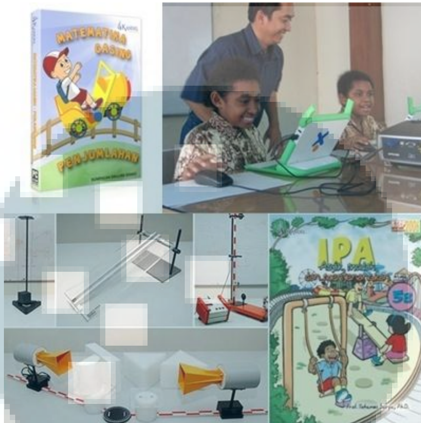
Gambar 2.5. Contoh produk dan pelatihan KANDEL

Sejak berdiri tahun 2006, penerbit KANDEL telah berkontribusi dalam peningkatan mutu pendidikan di Indonesia dengan produk dan layanan inovatif berupa buku teks pelajaran Matematika, IPA, dan fisika untuk tingkat SD-SMA. Sebagai satu-satunya penerbit yang mendapat kepercayaan untuk menerbitkan buku karangan Prof. Yohanes Surya, Ph.D., KANDEL terus berinovasi dan bertransformasi menjadi penerbit kelas dunia dengan visi menuju Indonesia Jaya (sumber: website KANDEL).