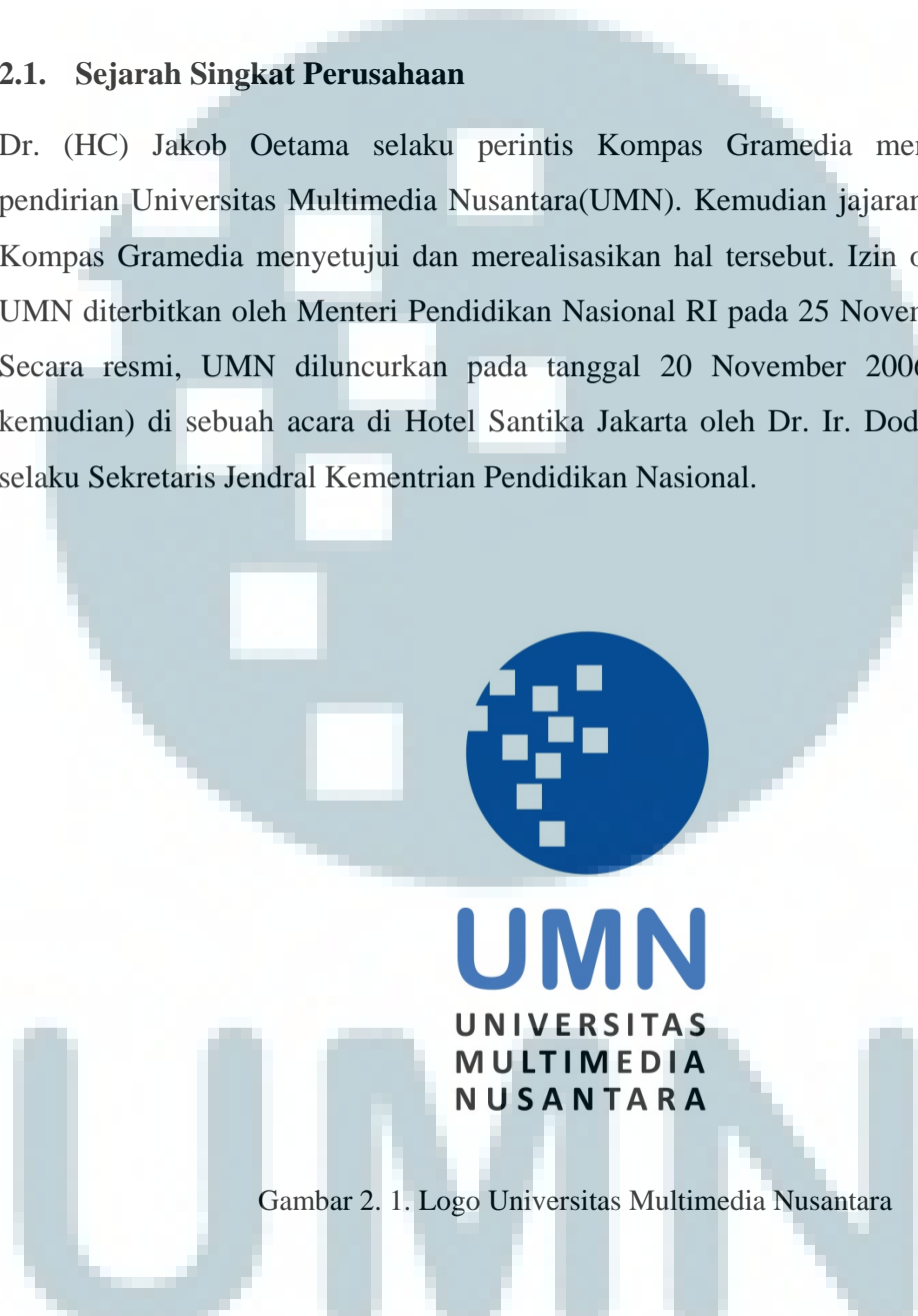
Gambar 2. 1. Logo Universitas Multimedia Nusantara