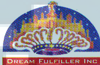
Gambar 2.1. Logo PT Dream Fulfiller Inc.