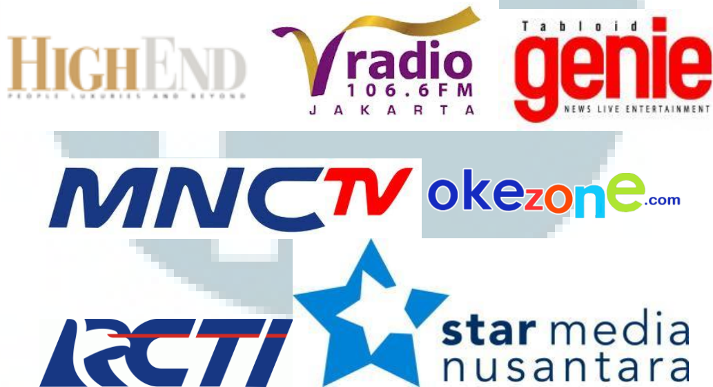
Gambar 2.3. Beberapa media dibawah naungan MNC