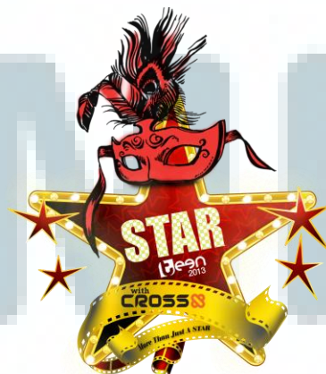
Gambar 2.7. Logo Starteen 2013

Ajang pencarian bakat ini berassaskan pada STAR, yang merupakan singkatan dari beberapa aspek penting yang dicari pada remaja Indonesia yaitu, Smart, Talented, Attractive, dan Reliable .