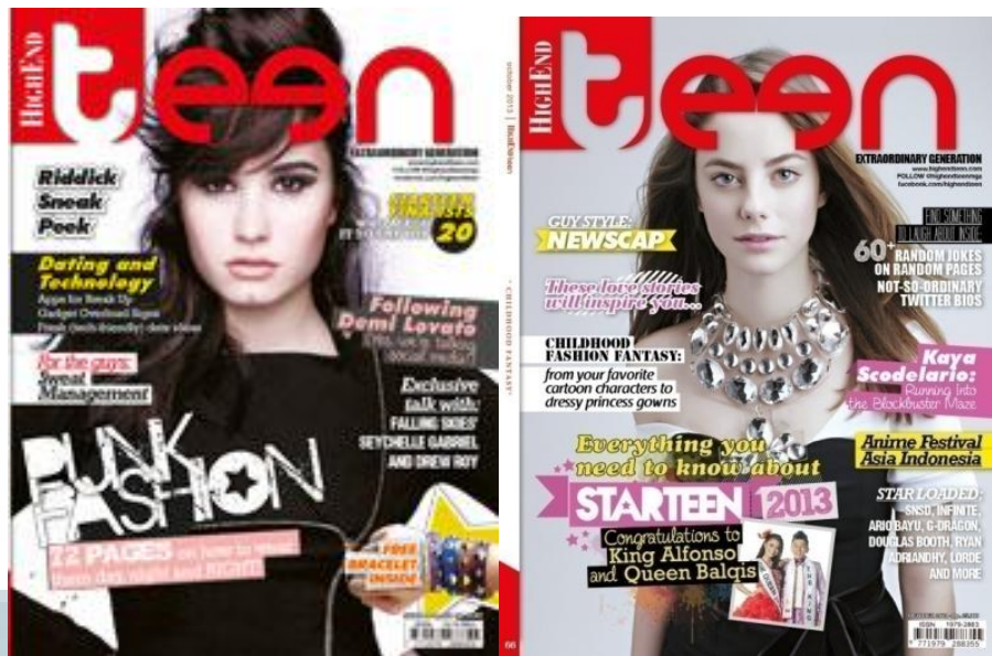
Gambar 2.6. Cover Majalah HighEnd Teen September dan Oktober 2013

Selain sebagai sumber informasi dalam bidang entertainment, majalah Highend Teen juga mengadakan pemilihan bintang cover majalah melalui ajang pencarian bakat tahunan bernama STARteen .