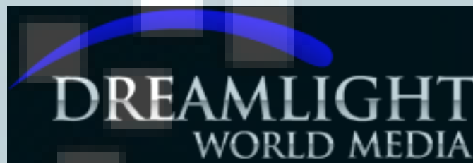
Gambar 2.3. Logo Dreamlight World Media

Dibawah ini merupakan gambar logo dari perusahaan Dream Dream World Media.