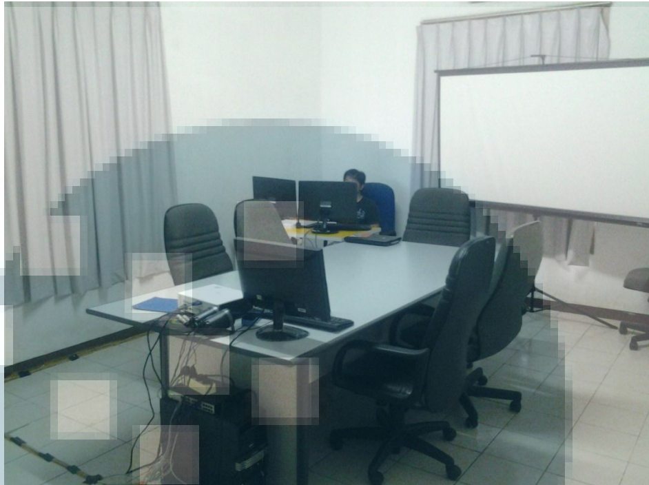
Gambar 2. 5 Ruang Rapat Lumine Studio

Gambar 2.5 adalah dokumentasi dari ruangan rapat Lumine Studio, di tempat ini biasa rapat diadakan seminggu sekali biasanya pada awal minggu, untuk membicarakan bagaimana hasil pekerjaan, juga untuk membahas mengenai pekerjaan atau tugas yang akan dijalankan oleh artist .