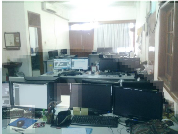
Gambar 2. 3 Ruang Kerja Animator

Gambar 2.3 ini adalah dokumentasi yang penulis ambil dari ruangan kerja para animator yang berada di ruangan depan pada lantai 2 studio. Para animator ditempatkan di ruangan depan karena jumlah animator paling banyak diantara divisi lain.