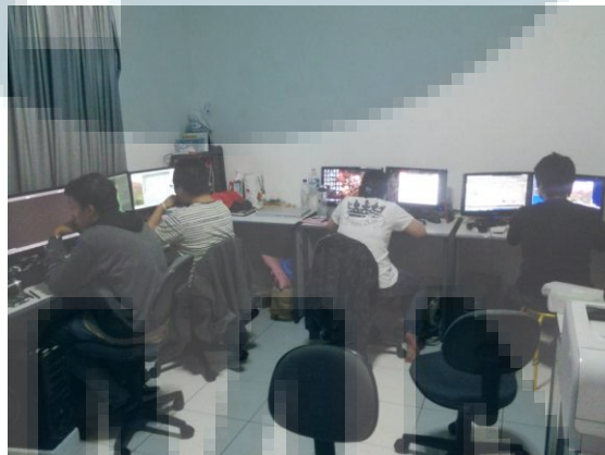
Gambar 2. 4 Ruang Kerja Generalis

Gambar 2.3 ini adalah dokumentasi yang penulis ambil dari ruangan kerja para animator yang berada di ruangan depan pada lantai 2 studio. Para animator ditempatkan di ruangan depan karena jumlah animator paling banyak diantara divisi lain.