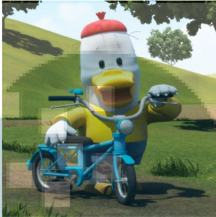
Gambar 2. 1 Serial "Noksu"

Nama Lumine sendiri memiliki arti cahaya, dan nama ini memiliki makna agar Lumine dapat memberikan cahaya bagi industri animasi. Gambar anak kecil pada logo yang membawa cahaya membentuk sebuah huruf, yaitu huruf L dan huruf ini mewakili nama studio yaitu Lumine.