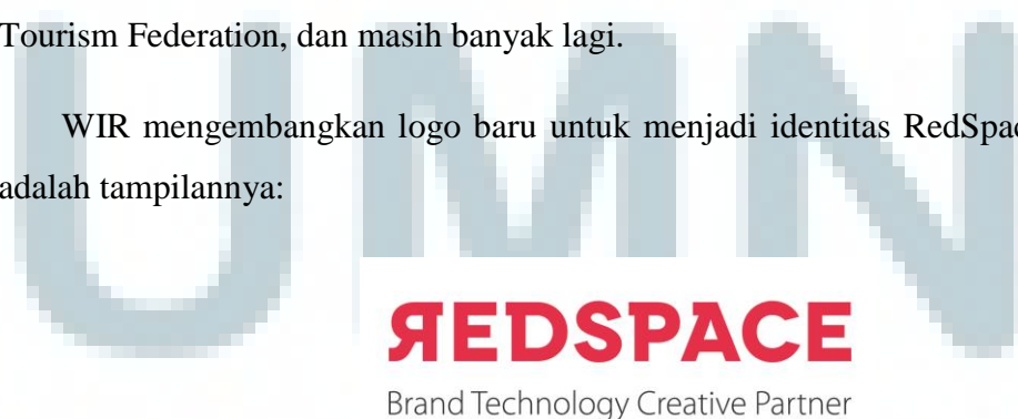
Gambar 2.2 Logo RedSpace

WIR mengembangkan logo baru untuk menjadi identitas RedSpace. Berikut adalah tampilannya: