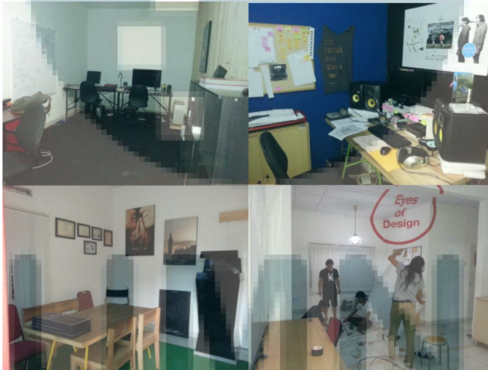
Gambar 2.1. Foto Perusahaan 1

PT. Sembilan Matahari adalah sebuah badan usaha dalam skema industri kreatif di negeri ini yang mengeksplorasi medium audio visual dengan cara-cara yang tidak biasa, baik dari segi proses pembuatan maupun penyajian kepada penonton. Produk yang dihasilkan perusahaan ini pada dasarnya adalah film. Namun, berangkat dari keputusan untuk memandangi proses pembuatan dan penyajian, film tidak hanya dari mata seorang film maker, namun lebih fokus dari seorang mata desainer serta bergerak dengan landasan design thinking , Sembilan Matahari menyajikan produk yang dinamakan designed film .