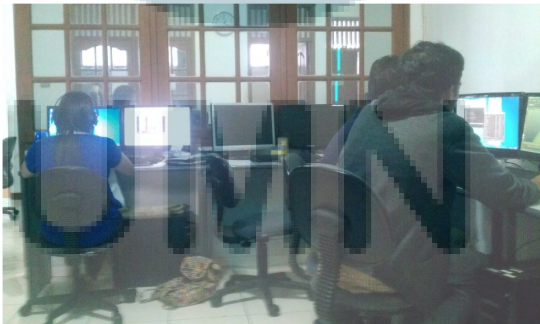
Gambar 2. 3 Suasana Kerja Ruangan Modeler

Gambar di atas merupakan suasana ruang kerja animator dimana animator mengerjakan proyek animasi, sedangkan di bagian ujung ruangan merupakan komputer milik Illustrator , namun posisi illustrator sekarang sedang kosong.