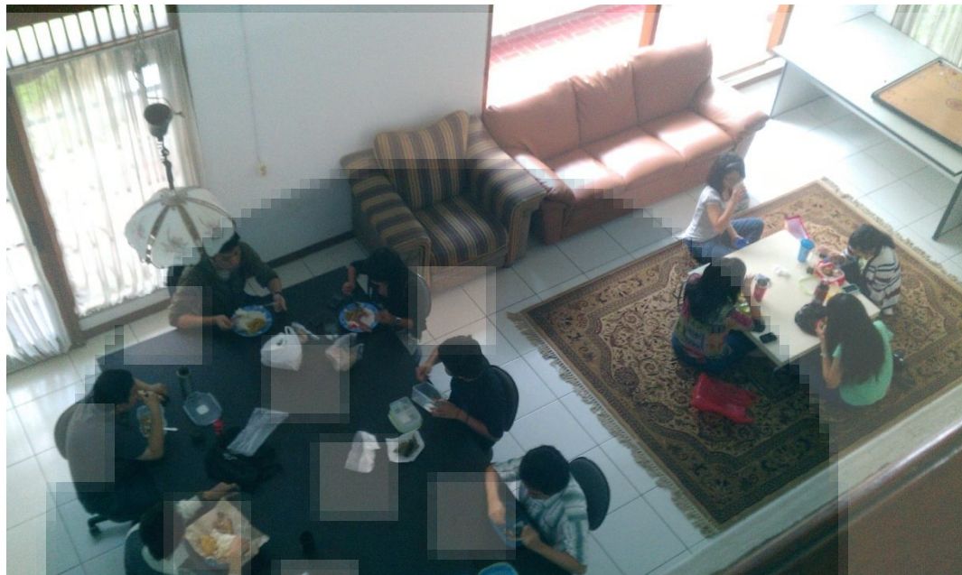
Gambar 2. 5 Suasana Ruang Makan Lumine Studio

Selain Ruang kerja yang telah dijelaskan sebelumnya, Lumine Studio memiliki ruang makan para karyawan yang terletak di lantai dasar seperti pada gambar di atas, para karyawan dan pekerja makan di meja bagian bawah tersebut. Di ruangan inilah para pekerja menghabiskan waktu istirahatnya, selain itu mereka juga bermain carambole juga uno di ruangan ini juga.