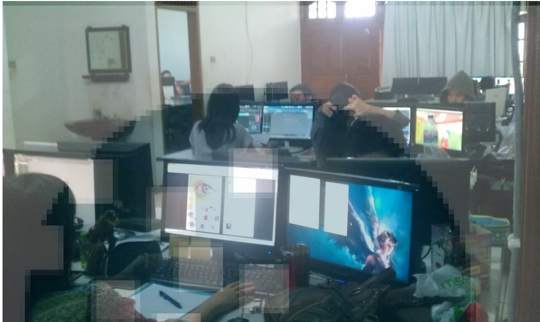
Gambar 2. 2 Suasana Ruang Kerja Animator

Gambar di atas merupakan suasana ruang kerja animator dimana animator mengerjakan proyek animasi, sedangkan di bagian ujung ruangan merupakan komputer milik Illustrator , namun posisi illustrator sekarang sedang kosong.