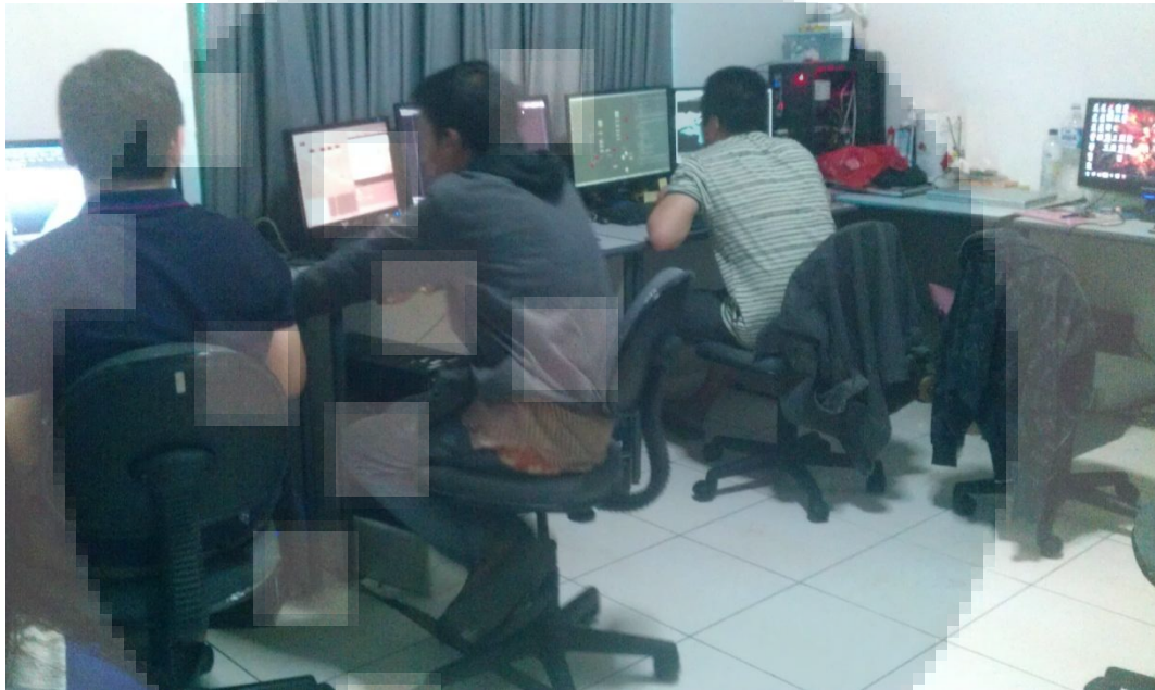
Gambar 2. 4 Suasana Ruangn Modeler dan Rigger

Gambar diatas merupakan ruangan modeler yang terpisah dari ruangan luar yang berisi para animator , di ruangan ini modeler lebih fokus ke dalam pekerjaannya sebagai modeler .