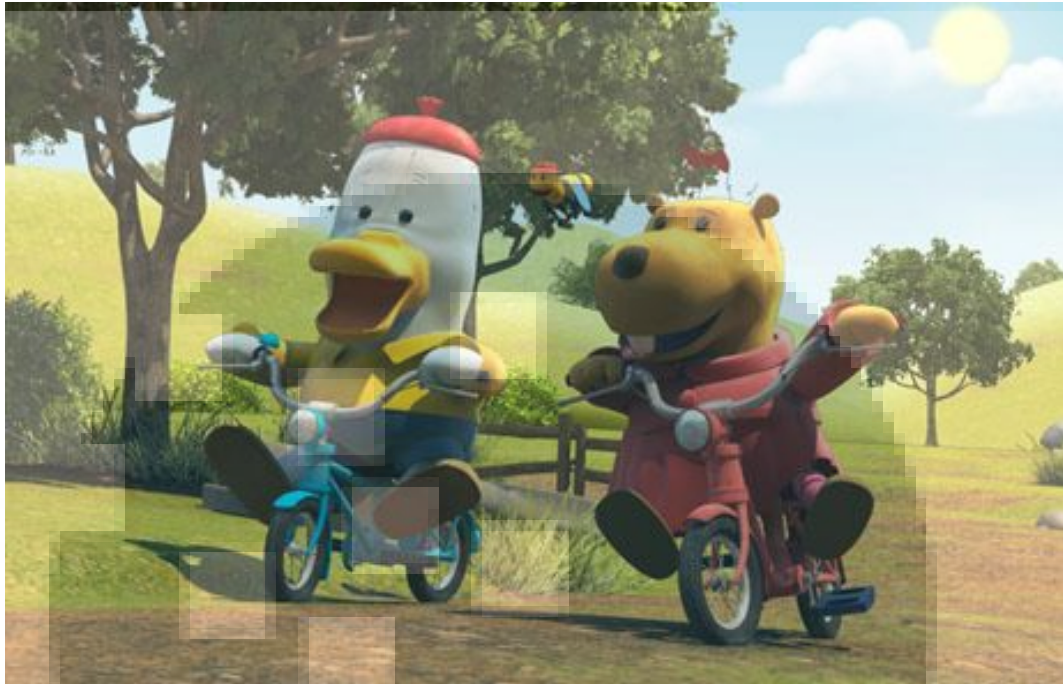
Gambar 2. 6 Serial Noksu

Lumine tidak hanya bekerja pada bidang animasi 3D saja melainkan juga multimedia. Banyak klien yang berasal dari luar negeri antara lain dari Singapore, Canada, Filipina. Kemudian klien Lumine mulai menjalar ke klien dari Eropa.