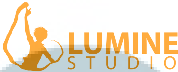
Gambar 2. 1 Logo Lumine Studio

Lumine Studio mengambil kata Lumin yang artinya cahaya, atau terang. Lumine sendiri memiliki makna cahaya, cahaya tersebut merupakan cahaya terang dan dalam yang menerangi ke dalam dunia animasi.