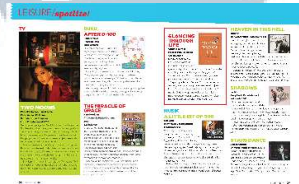
Gambar 3.2. Leisure/Spotlite Edisi 20