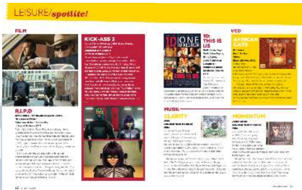
Gambar 3.1. Leisure/Spotlite Edisi 18