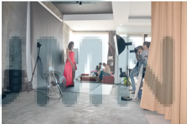
Gambar 2.5. Suasana Photoshoot