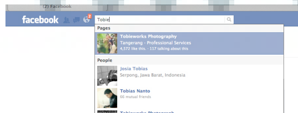
Gambar 2.2. Keyword Facebook “Tobi”