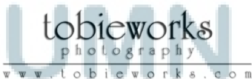
Gambar 2.1. Logo Perusahaan Tobieworks Photography