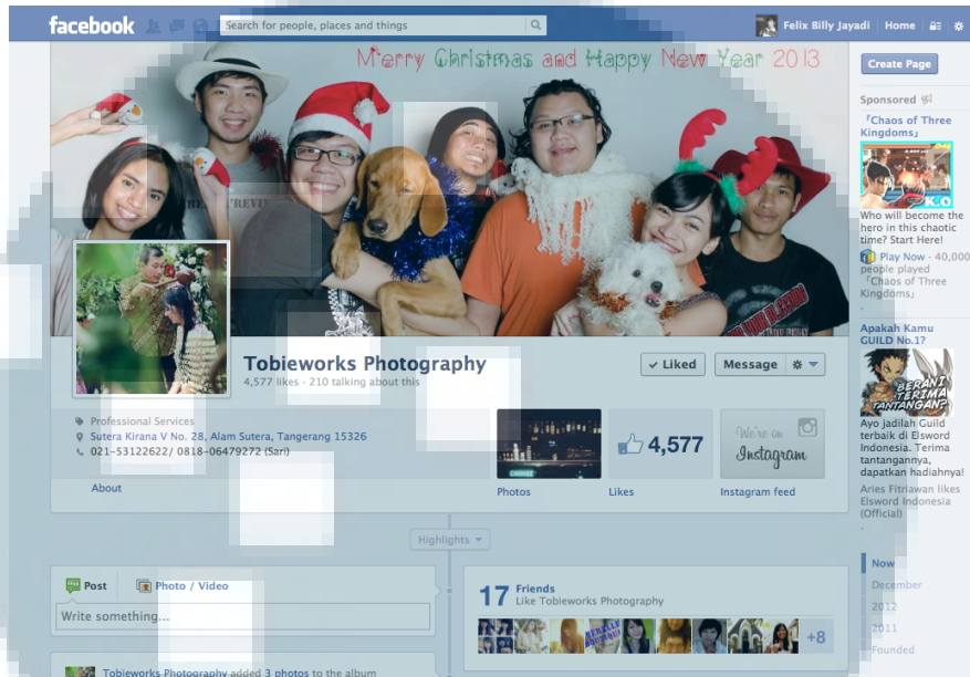
Gambar 2.3. Tampilan halaman facebook Tobieworks Photography

Dengan membuka media jejaring sosial yang ramai dengan mengetik kata “Tobi”.