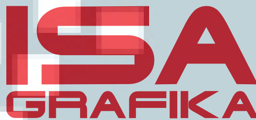
Gambar 2.1 Logo Isa Grafika