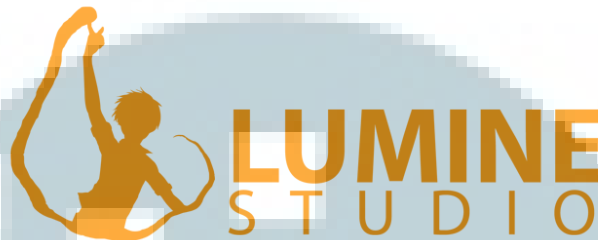
Gambar 2.1 Logo Lumine Studio

dalam animasi yang dibuat oleh Lumine , serta warna oranye merupakan salah satu warna cahaya.