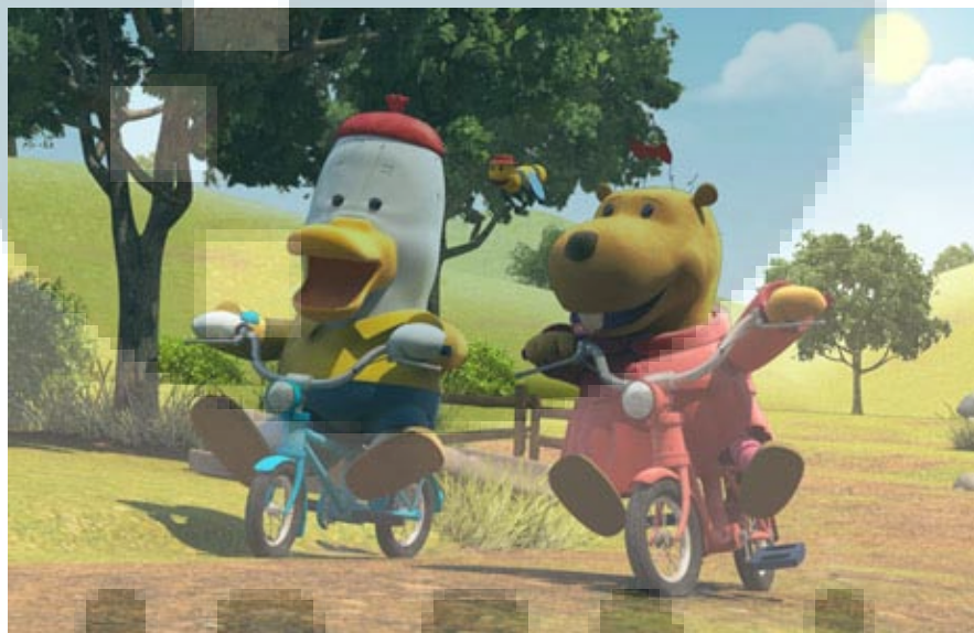
Gambar 2.2 Serial Animasi Noksu and His Friends

Noksu memiliki karakter-karakter lain dalam serialnya, yaitu Betty Beaver (berang-berang), Monty Mole (tikus tanah), Charlie Croc (buaya), Buster (lalat), Mrs. Hen dan Baby Egg (ayam dan telurnya), Dr. OK (gorila) dan Jolie Brum-brum (kambing).