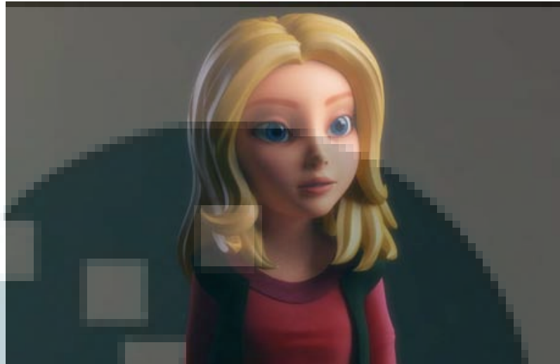
Gambar 2.4 Karakter Utama Wendy