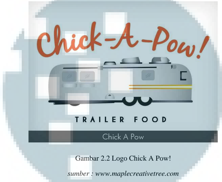
Gambar 2.2 Logo Chick A Pow!