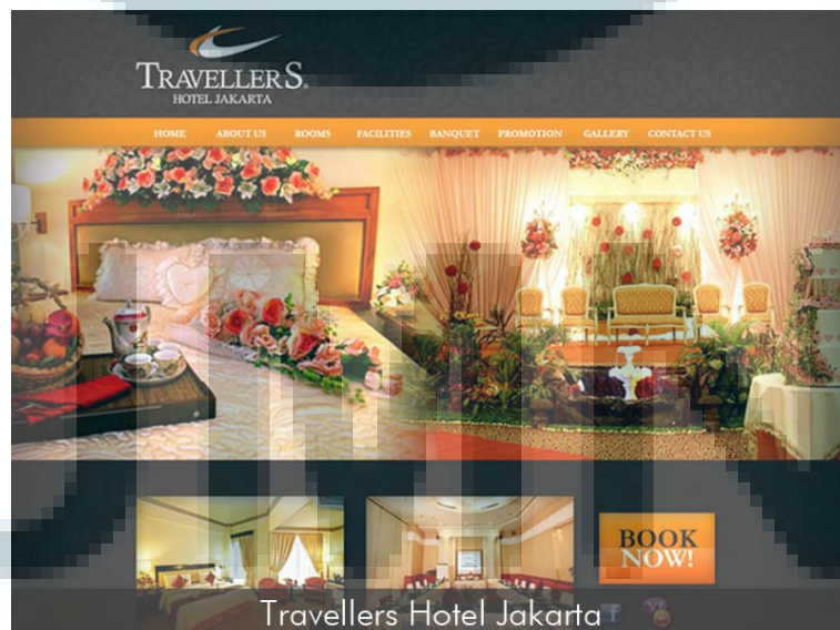
Gambar 2.3 Website Travellers Hotel Jakarta