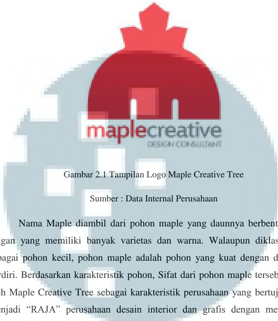
Gambar 2.1 Tampilan Logo Maple Creative Tree