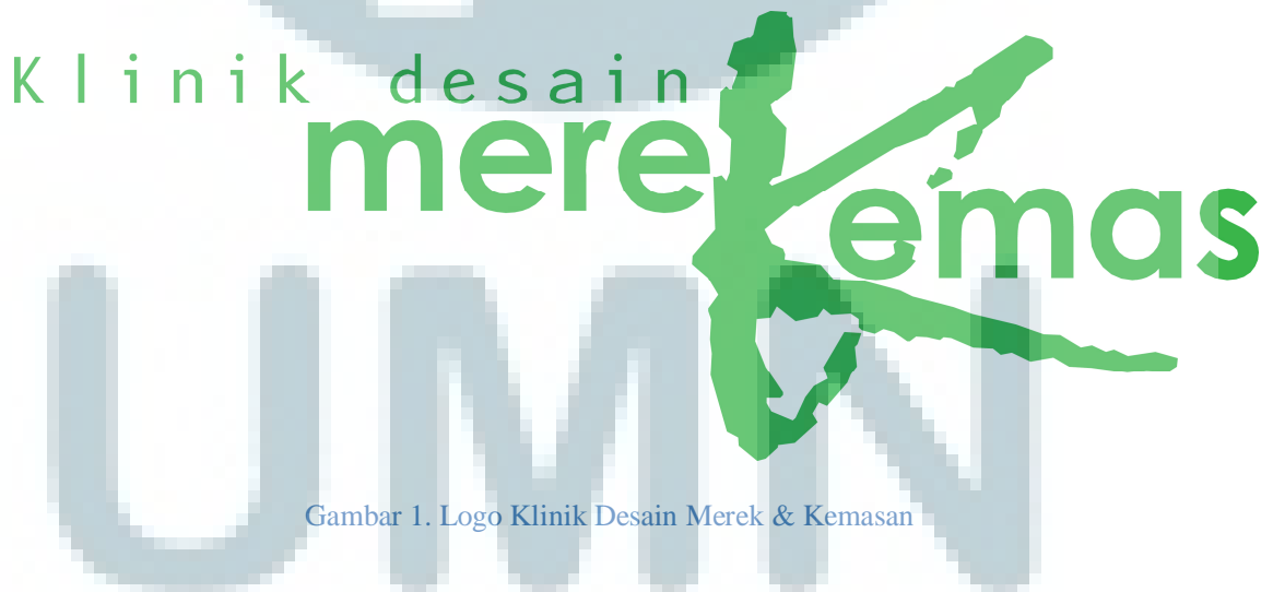
Gambar 1. Logo Klinik Desain Merek & Kemasan