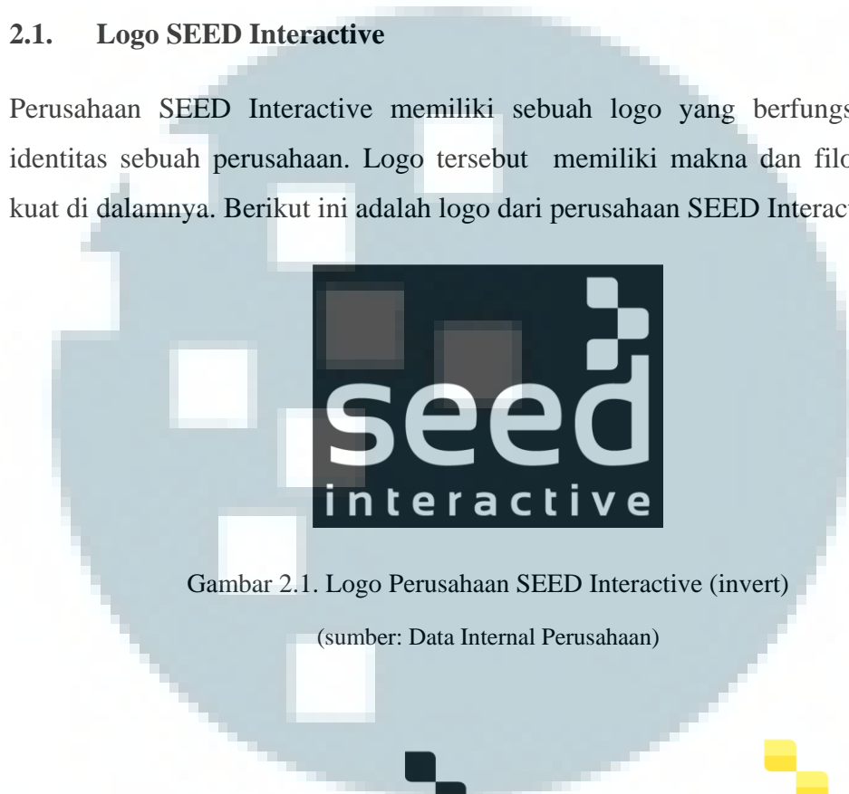
Gambar 2.1. Logo Perusahaan SEED Interactive (invert)

Perusahaan SEED Interactive memiliki sebuah logo yang berfungsi sebagai identitas sebuah perusahaan. Logo tersebut memiliki makna dan filosofi yang kuat di dalamnya. Berikut ini adalah logo dari perusahaan SEED Interactive: