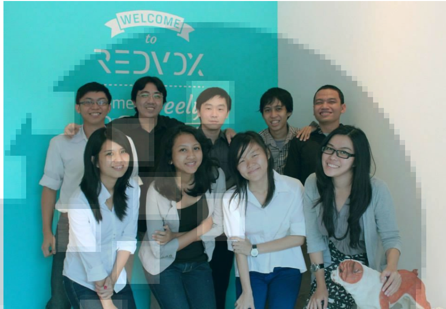
Gambar 2.6. Foto Penulis Dengan Staff SEED Interactive dan Redvox

Berikut ini adalah dokumentasi yang diambil selama menjalani praktik kerja magang dengan perusahaan SEED Interactive: