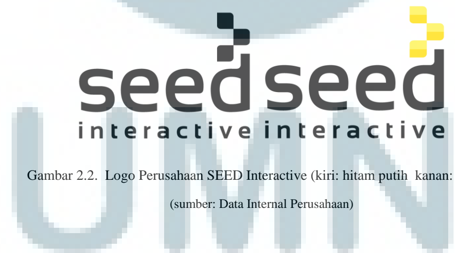
Gambar 2.2. Logo Perusahaan SEED Interactive (kiri: hitam putih kanan: warna)