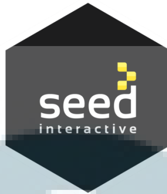
Gambar 2.3. Logo Perusahaan SEED Interactive (dengan lock up)