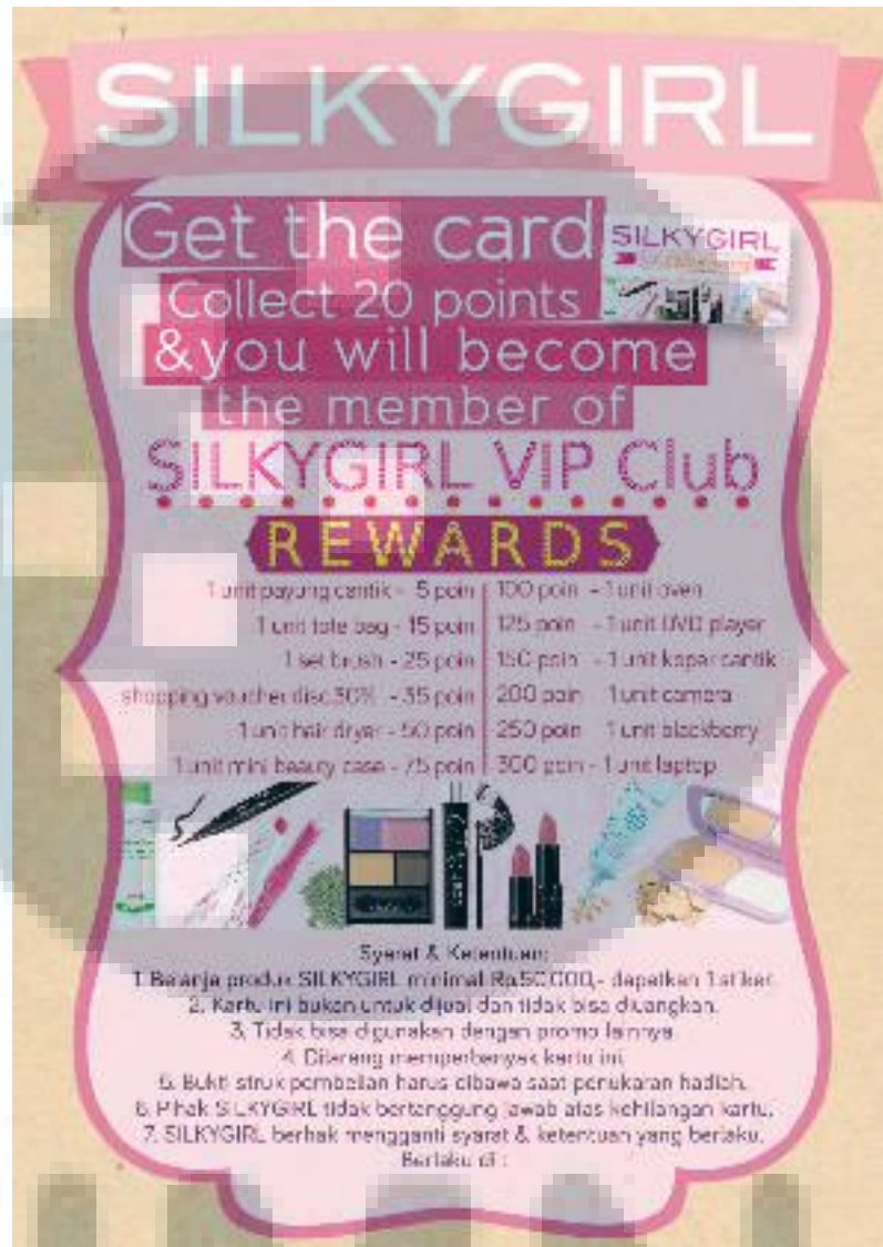
Gambar 3.19 Desain Layout Poster VIP Member Card SILKYGIRL .