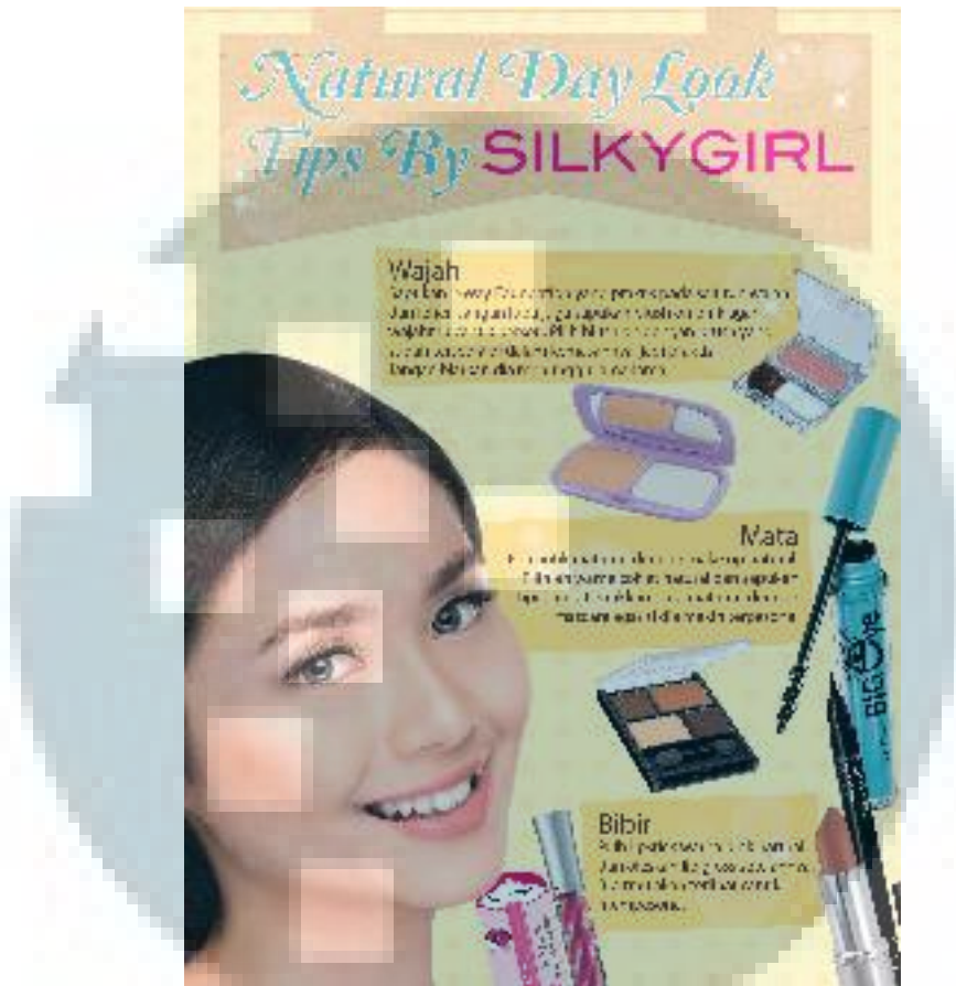
Gambar 3.16 Hasil Desain Layout Natural Beauty Tips