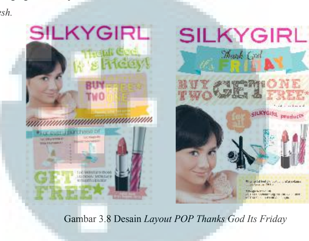
Gambar 3.8 Desain Layout POP Thanks God Its Friday

Penulis menggunakan Adobe Photoshop untuk sekedar tracing foto model dan produk-produk kosmetik. Ketelitian dalam tracing harus rapi dan perlu diperhatikan juga mengingat bahwa produk kosmetik dan kecantikan harus selalu terlihat berkilau dan fresh .