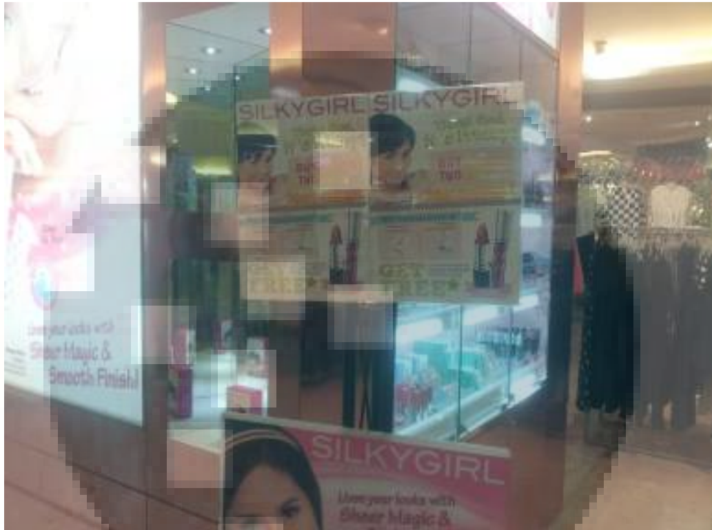
Gambar 3.10 Aplikasi Desain POP di Counter SILKYGIRL Plaza Semanggi