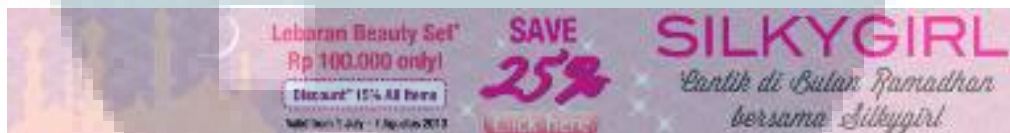
Gambar 3.6 Desain Web Banner Zalora

Pada minggu kedua kerja magang penulis mendapat proyek untuk membuat animated web banner untuk dipasang di web Zalora . SILKYGIRL akan menjual paket produk di web tersebut, dan karena menjelang lebaran maka penulis diminta untuk membuat web banner tersebut dengan nuansa ramadhan. Tantangan dalam proyek ini adalah penulis harus membuat banner tersebut menggunakan Adobe Flash . Pertama-tama penulis membuat layout banner yang diinginkan di Adobe Illustrator . Semua materi gambar, foto, background dan elemen grafis yang ada di Adobe Illustrator disimpan dalam bentuk TIFF atau PNG , kemudian di import ke dalam Adobe Flash . Setelah itu barulah di Adobe Flash semua elemen tersebut digerakkan. Tantangan dalam pengerjaan proyek ini adalah apabila ada perubahan atau revisi maka desainer harus merubahnya dari keyframe awal lagi hingga akhir.