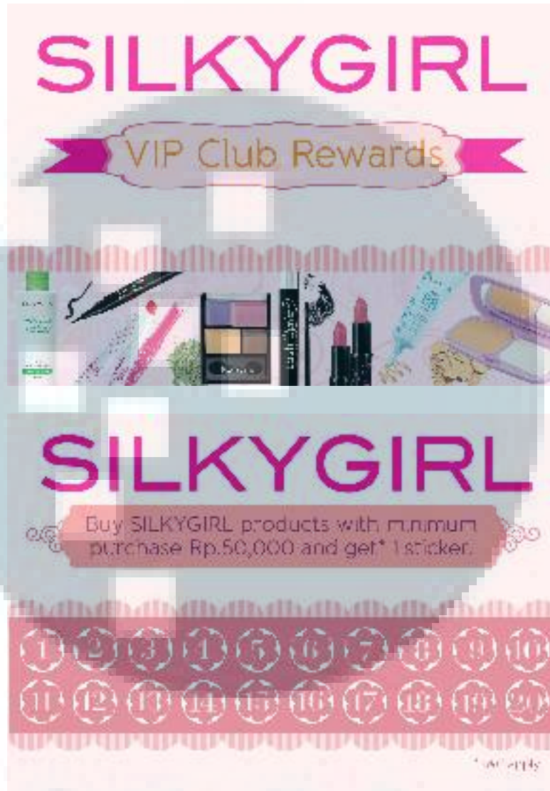
Gambar 3.17 Desain Tampak Depan dan Belakang VIP Member Card SILKYGIRL