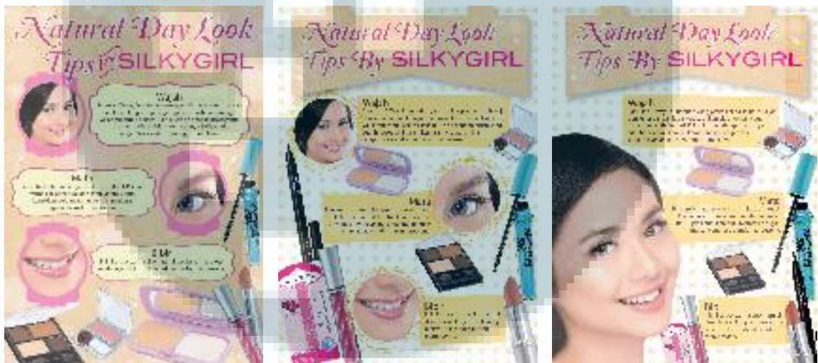
Gambar 3.15 Tiga Desain Alternatif Natural Beauty Tips

Kali ini penulis diminta untuk membuat desain layout tips make up berukuran A4 yang nantinya akan dipasang dalam buku notes . Dalam pengerjaan desain ini penulis mengalami empat kali revisi. Revisi tersebut mulai dari perubahan elemen grafis, warna, font , dan foto yang digunakan. Proyek kali ini penulis juga mendapat kritik dari pembimbing mengenai desain penulis jangan terlalu kaku. Mendapat kritik tersebut maka penulis mencari lagi referensi dari melihat gaya layout tips make up di majalah.