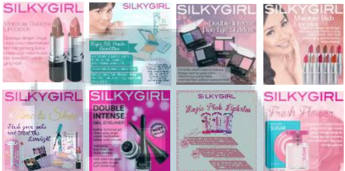
Gambar 3.1 Desain Banner Product Knowledge