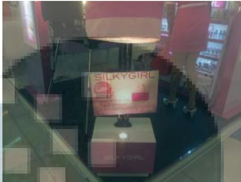
Gambar 3.12 Aplikasi Desain POP di Counter Silkygirl Guardian Supermall Karawaci