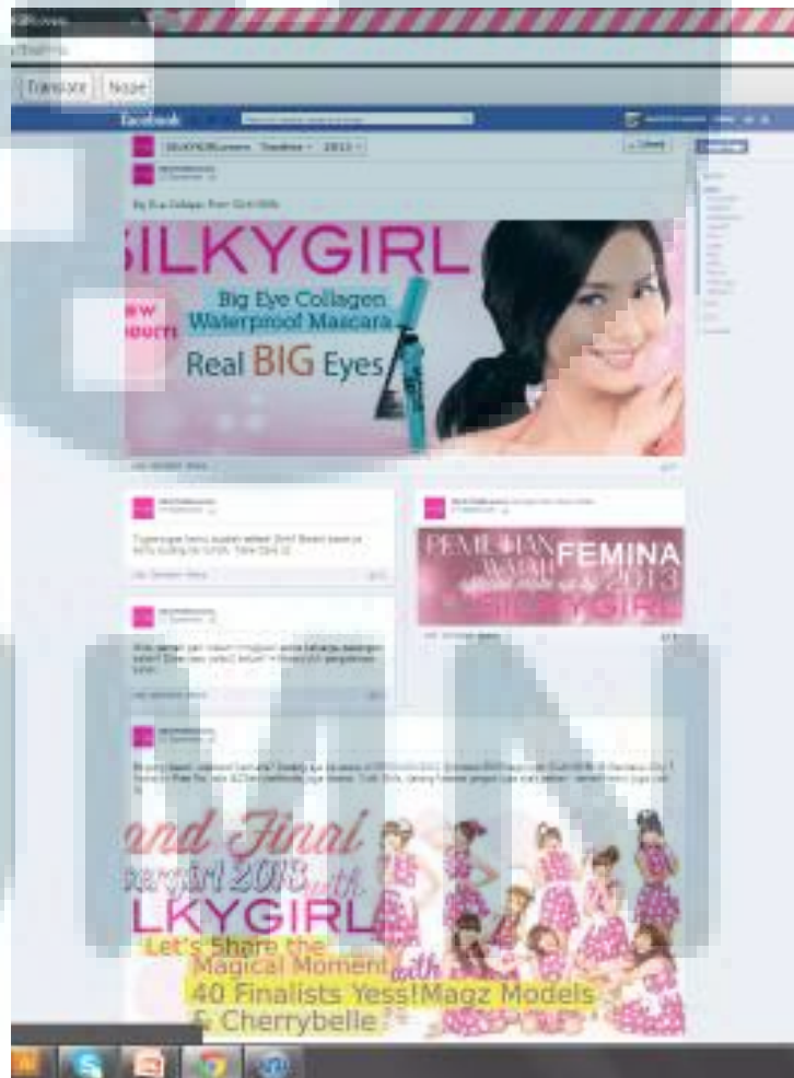
Gambar 3.4 Aplikasi Banner di Social Media Facebook