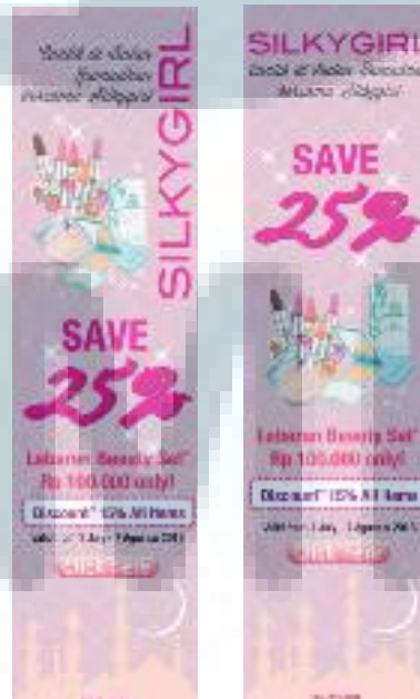
Gambar 3.7 Alternatif Desain Web Banner Zalora