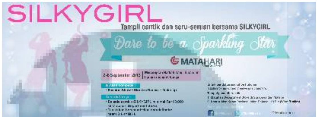
Gambar 3.3 Desain Banner Facebook Edisi Event Delta Surabaya