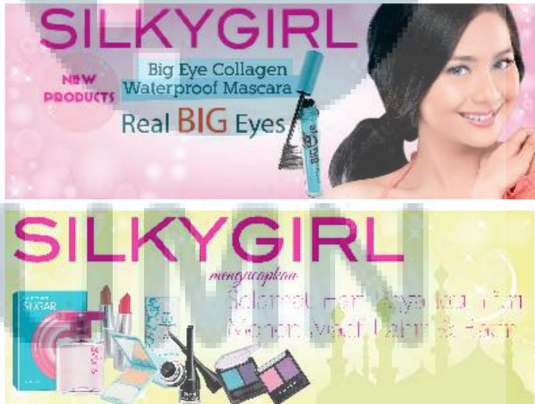
Gambar 3.2 Desain Header Facebook