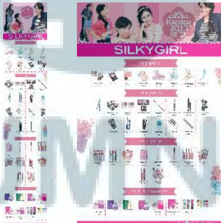
Gambar 3.5 Desain Layout Katalog Produk SILKYGIRL

Di minggu pertama kerja magang, penulis mendapat proyek untuk membuat katalog produk SILKYGIRL . Katalog produk tersebut akan ditampilkan di facebook dan blog . Untuk pengerjaan proyek katalog produk ini penulis diberi tugas untuk mendesain layout . Stok foto model dan produk sudah ada dan penulis bisa memakainya. Tantangan yang dihadapi penulis saat mengerjakan proyek ini adalah konten isi produk yang cukup banyak. Mengingat hal tersebut, maka penulis membuat desain yang simple dan mengutamakan kerapihan. Foto produk rata-rata berukuran 2MB, sehingga penulis kesulitan dalam menyimpan file akhir. Tapi hal tersebut bisa diatasi, karena seharusnya file tersebut disimpan dengan save for web . Tantangan selanjutnya adalah perubahan ukuran artboard terjadi beberapa kali karena ternyata saat dimasukkan ke dalam facebook dan blog ukurannya tidak pas. Hal ini sangat membuang-buang waktu penulis karena perubahan ukuran mempengaruhi layout tata letak produk.