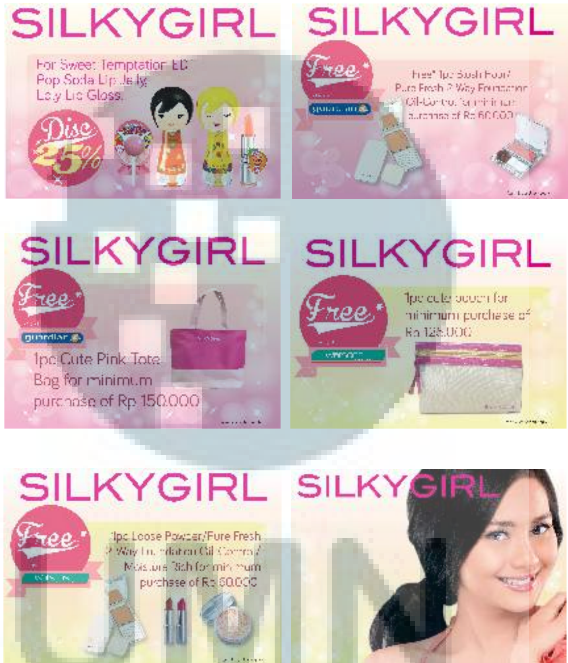
Gambar 3.11 Desain POP SILKYGIRL untuk Guardian dan Watson