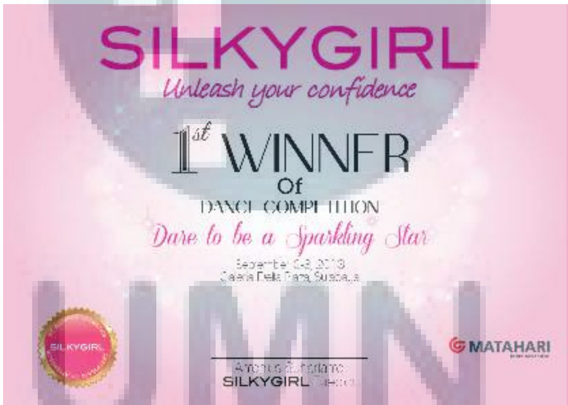
Gambar 3.14 Desain Master Piagam Event Delta Surabaya

SILKYGIRL membuat acara di Mall Delta Surabaya dan salah satu agenda dalam acara tersebut yaitu ada beberapa lomba yang diadakan. Untuk itu dibutuhkan piagam untuk diberikan kepada para pemenang. Piagam tersebut akan diberikan untuk juara 1-3 di masing-masing kategori, dance competition , fashion show competition , dan makeup competition . Maka dari itu penulis diberi tugas untuk membuat satu master desain piagam. Penulis diminta untuk membuat desain yang simple berwarna pink khas SILKYGIRL . Sesuai dengan tema acara tersebut yaitu dare to be sparkling maka penulis menggunakan elemen grafis bintang-bintang dan bubble serta background soft pink dengan gradasi putih di tengah agar terfokus pada title pemenang.