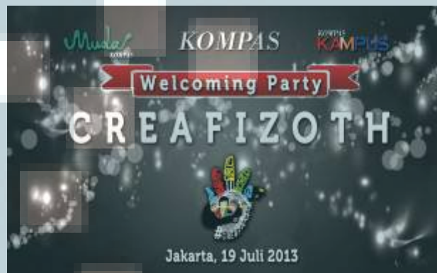
Gambar 3.4. Alternatif desain backdrop II