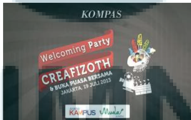
Gambar 3.5. Alternatif desain backdrop III