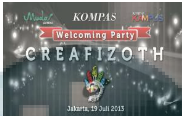
Gambar 3.3. Alternatif desain backdrop I