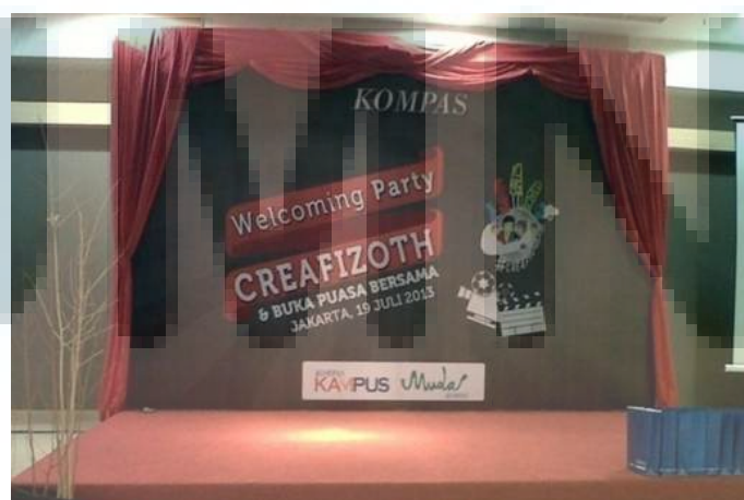
Gambar 3.6 Aplikasi desain backdrop Inagurasi “Magangers”

Penulis merasa bangga karena telah dipercayai untuk mendesain semua kebutuhan dan keperluan pada acara Inagurasi “Magangers”. Penulis juga merasa senang saat mengunjungi acara tersebut karena semua desain yang ada di acara tersebut adalah buatan penulis. Selain itu, acara “magangers” ini juga masuk berita di rubrik Kompas Muda Harian Kompas . Di bawah ini adalah tampilan backdrop yang digunakan saat acara tersebut telah berlangsung.