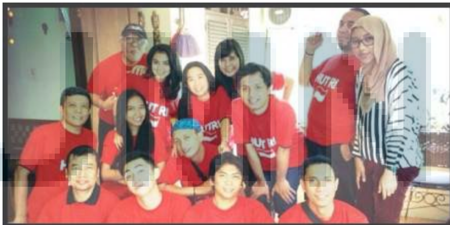
Gambar 3.1. Penulis bersama dengan sebagian Tim Marketing Communication

Marketing Communication (MarComm) di PT Kompas Media Nusantara mempunyai peranan penting untuk mengkomunikasikan identitas korporat dengan komunikasi yang baik serta terpadu. Strategi komunikasi yang dilakukan oleh Marketing Communication selain harus berjalan dengan baik, juga harus tepat sasaran. Komunikasi dilakukan melalui kegiatan iklan promosi perusahaan, event , customer relation , pelayanan hotline , pelayanan kepuasan pelanggan dan mitra kerja, serta penciptaan brand awreness . Komunikasi tersebut merupakan strategi-strategi yang dilakukan oleh Marketing Communication untuk mempertahankan brand Kompas di mata pembaca, pengiklan, dan mitra kerja Kompas .