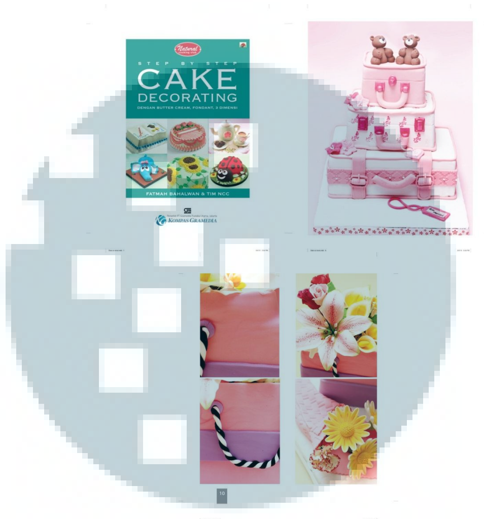
Gambar 3.4 Isi buku Cake Decorating

Cake Decorating merupakan buku berisikan cara menghias kue dan pernah diterbitkan sebelumnya oleh Gramedia Pustaka Utama. Penulis bertugas untuk mengoreksi warna, memperbaiki gambar yang rusak, serta merubah format gambar dari RGB menjadi CMYK (warna cetak) agar bisa dicetak kembali. Kendala yang dihadapi penulis selama proses pengerjaan adalah hilangnya beberapa file gambar yang menyebabkan error pada file isi buku cake decorating . Selain itu, jumlah file yang berjumlah ratusan gambar membutuhkan waktu yang lama untuk diedit. Hal terpenting untuk menyelesaikan tugas ini