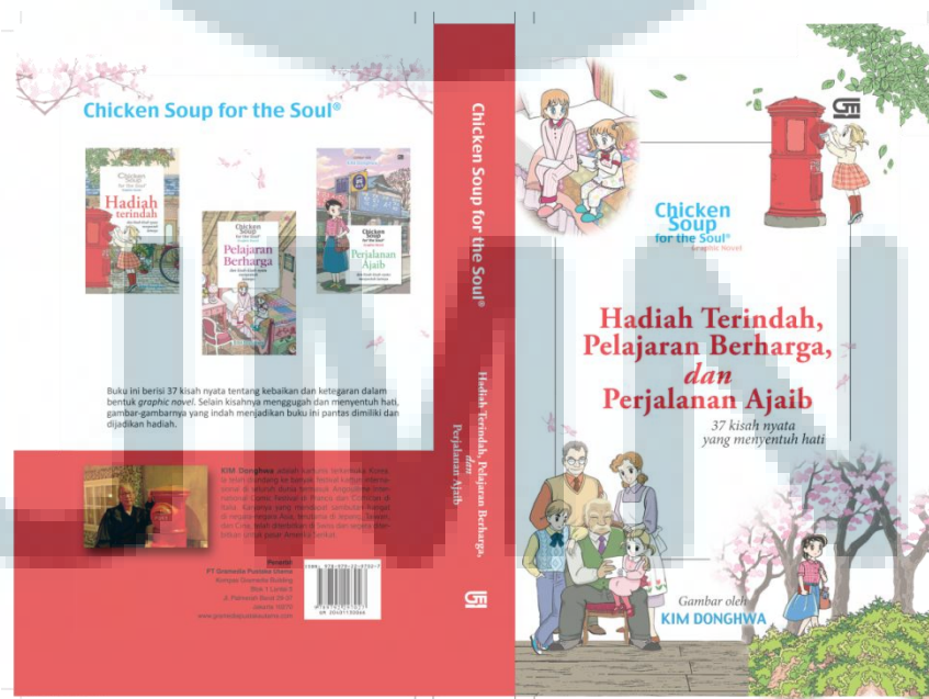
Gambar 3.1 Cover Kumpulan Graphic Novel Chicken Soup