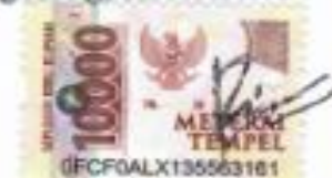
Rio Rivaldo Wijaya