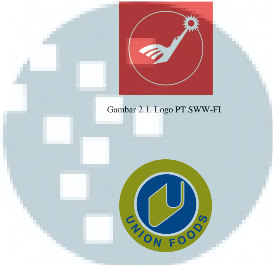
Gambar 2.1. Logo PT SWW-FI

Perusahaan lalu mengganti nama dari PT. SWW-FI menjadi PT. Union Foods pada 14 April 2009 karena mengalami perubahan kepemilikan perusahaan. Logo yang digunakan pun berubah seperti gambar di bawah ini.