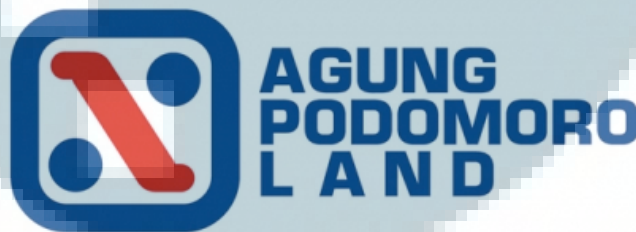
Gambar 2.1.1. Logo Agung Podomoro Land Sumber : Data Pribadi Perusahaan