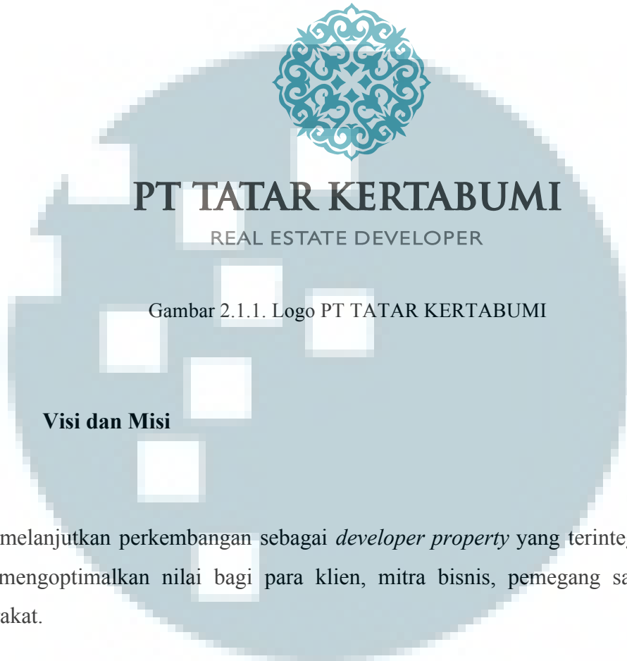
Gambar 2.1.1. Logo PT TATAR KERTABUMI