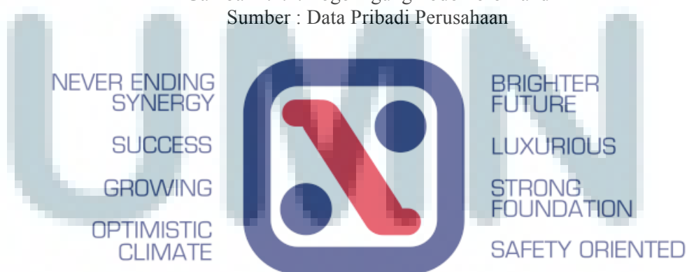
Gambar 2.1.1. Identity Philosophy APL