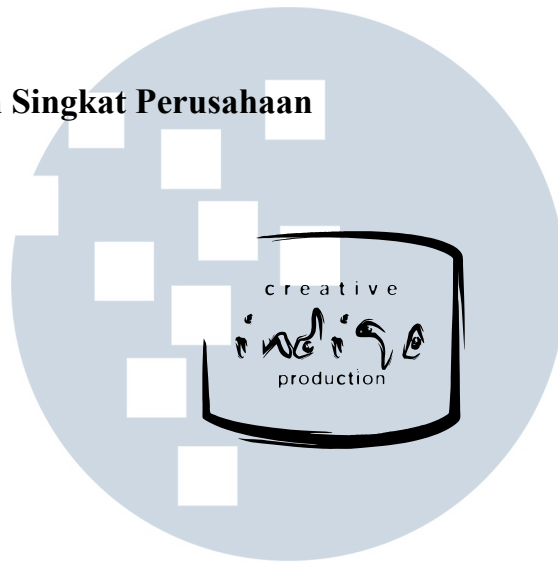
Gambar 2.1 Logo Perusahaan

PT. Creative Indigo Production atau yang lebih dikenal Indigo merupakan Production House yang didirikan sejak tahun 1997. Production House ini berada di Cilandak tepatnya di Jalan Caringin Barat Kav.10. Indigo memiliki peranan dalam bidang broadcasting seperti periklanan, infotainment, reality show , Sitcom, feature , talk show , dll.