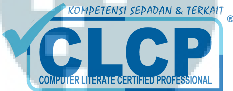
Gambar 2.2 Logo TUK-TIK