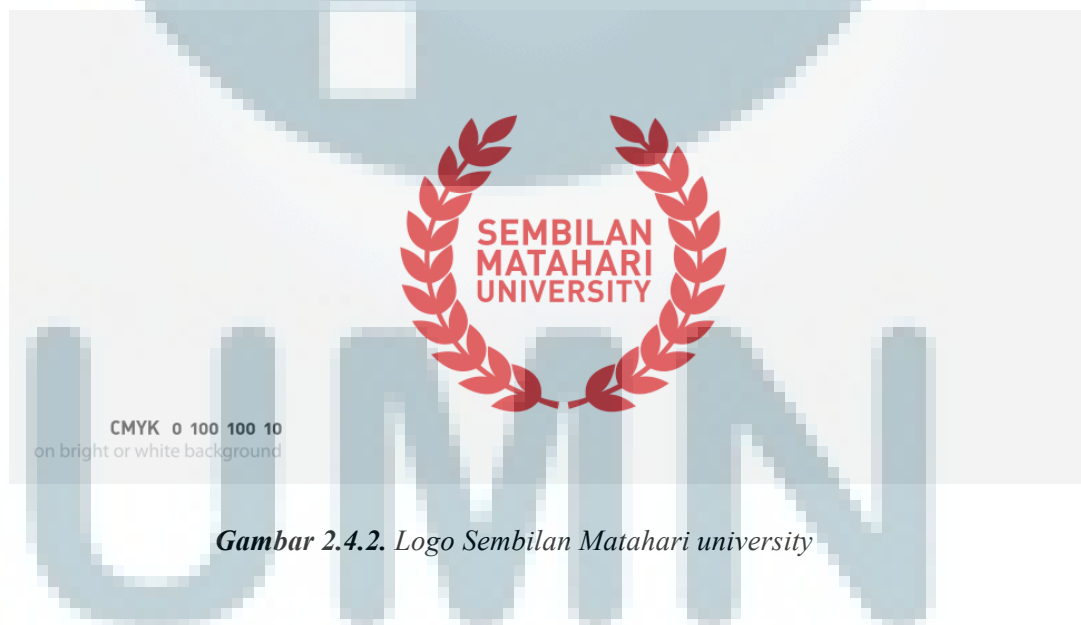
Gambar 2.4.2. Logo Sembilan Matahari university

Selain itu, Sembilan Matahari juga mengembangkan apa yang disebut sebagai “Sembilan Matahari University ”. Melalui konsep “ university ” PT. Sembilan Matahari memberikan creative empowerment pada generasi muda melalui program magang yang terbuka bagi para mahasiswa ataupun siswa-siswi SMK untuk terlibat dalam berbagai proyek. Selain itu, program workshop yang mengeksplorasi berbagai topik dari berbagai disiplin ilmu, Exploratory Lab , menjadi wadah knowledge sharing yang menjadi salah satu nilai yang dipegang oleh perusahaan ini.