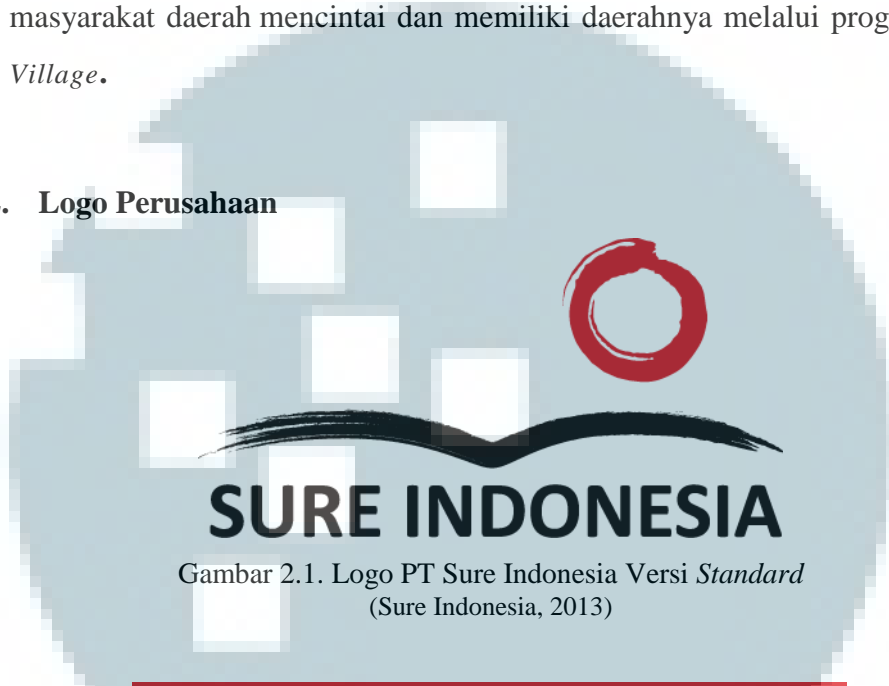
Gambar 2.1. Logo PT Sure Indonesia Versi Standard (Sure Indonesia, 2013)