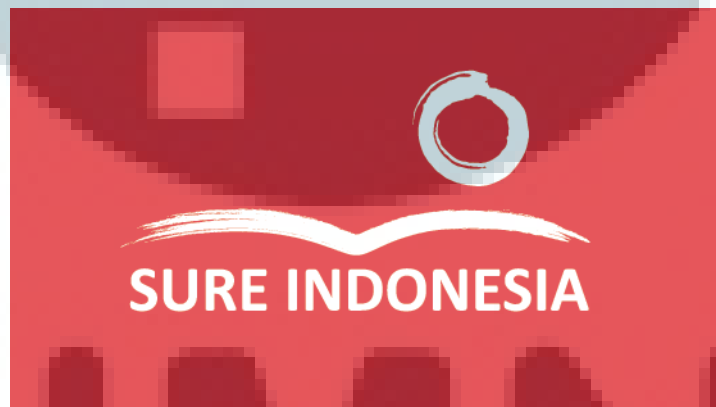
Gambar 2.2. Logo PT Sure Indonesia Versi Inverted (Sure Indonesia, 2013)

Logo PT Sure Indonesia terdiri dari logogram dan logotype. Logotype terdiri dari nama perusahaan yaitu Sure Indonesia, sedangkan logogram terdiri dari elemen grafis berbentuk buku terbuka yang melambangkan PT Sure Indonesia sebagai perusahaan yang bergerak di bidang pendidikan. Bentuk lingkaran merupakan