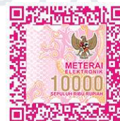
Thobiaz Imanuel Silalahi