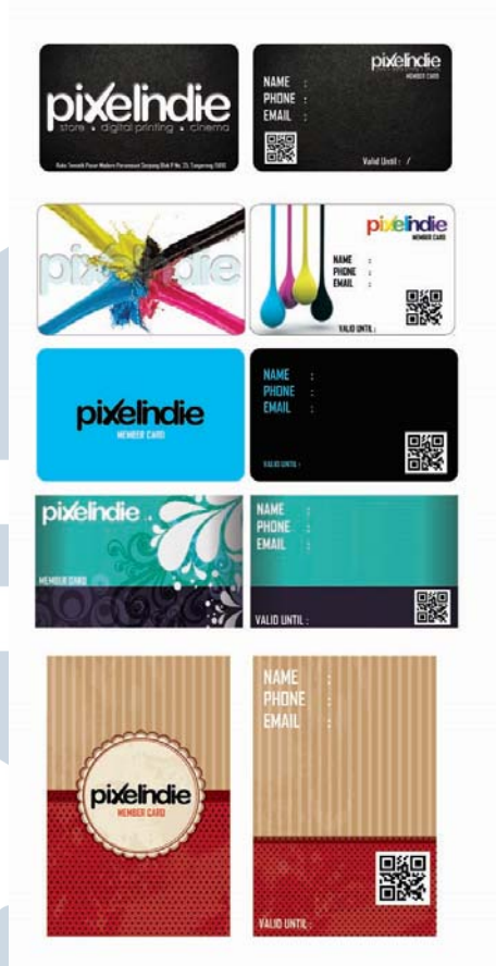
Gambar 12. Member Card