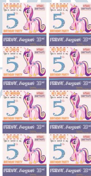
Gambar 11. Birthday Card