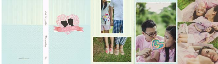
Gambar 14. Wedding Album Layout

Penulis mengalami beberapa kendala selama masa praktek kerja magang. Salah satunya adalah tentang konsep desain yang dibuat sesuai dengan keinginan klien dan penguasaan software yang digunakan untuk mendesain. Penulis sudah terbiasa memakai Adobe illustrator dan photoshop namun ada beberapa tools dan penggunaan effects yang masih belum diketahui secara penuh oleh penulis.