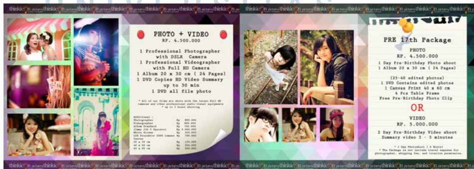
Gambar 13. Price List Event Organizer