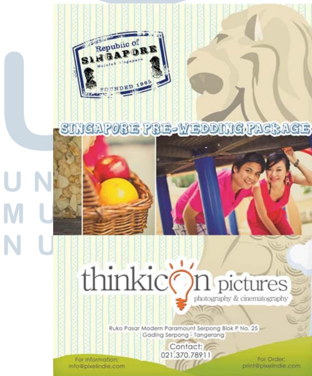
Gambar 9. Brosur Singapore Depan