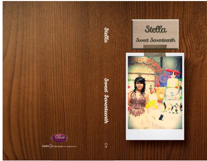
Gambar 6. Cover Album