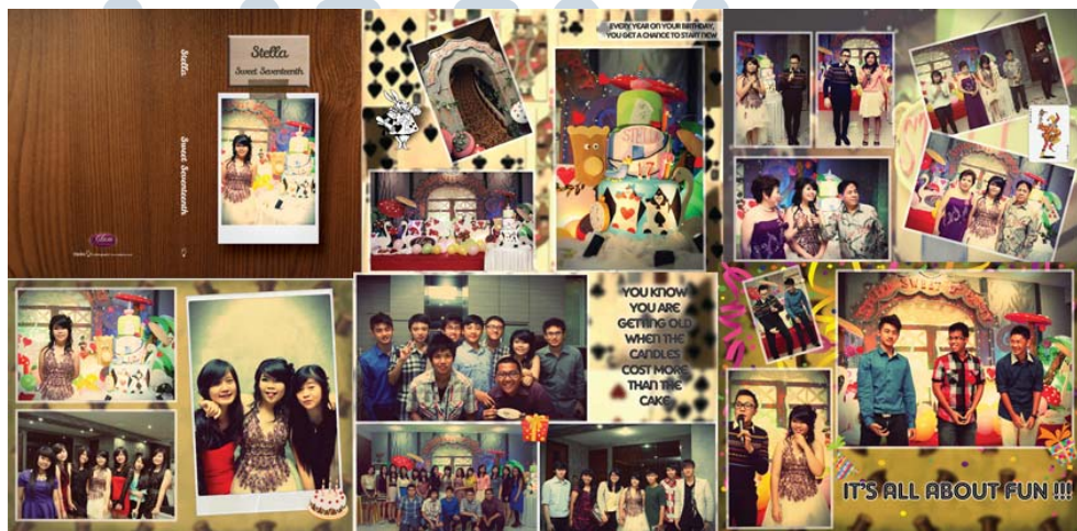
Gambar 7. Layout Album