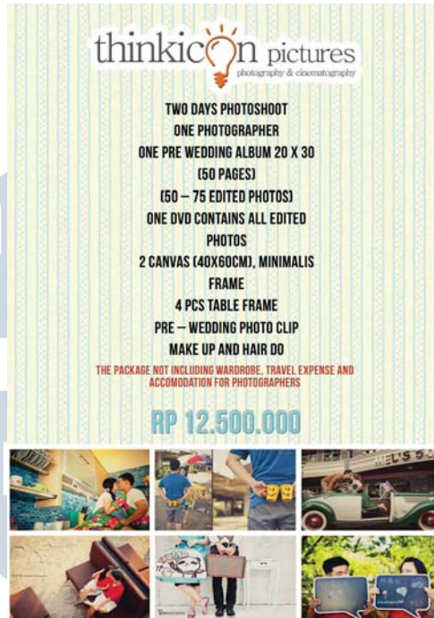
Gambar 10. Brosur Singapore Belakang