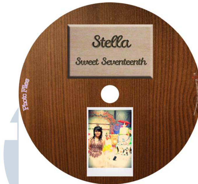
Gambar 8. Cover CD