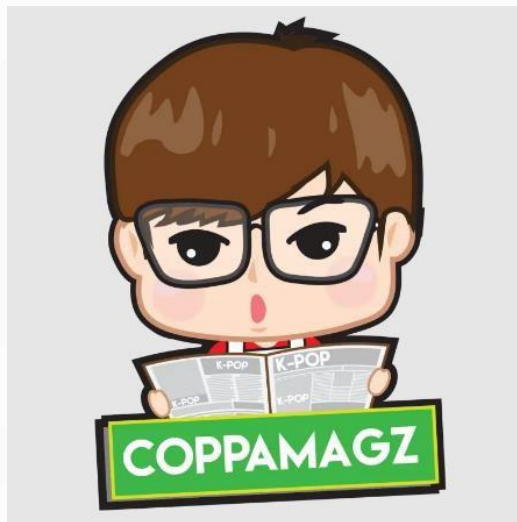
Gambar 2.1 Logo Coppamagz