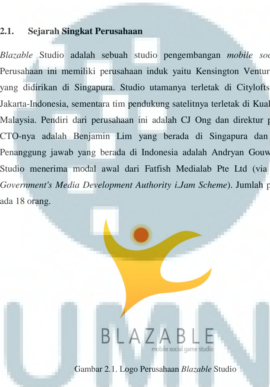
Gambar 2.1. Logo Perusahaan Blazable Studio