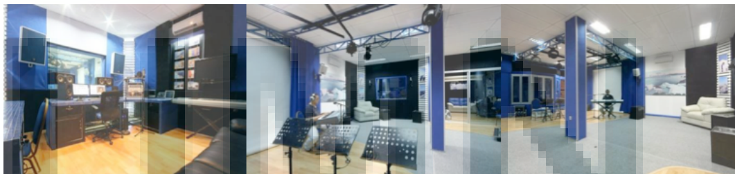
Gambar 2.2. Studio Santorini