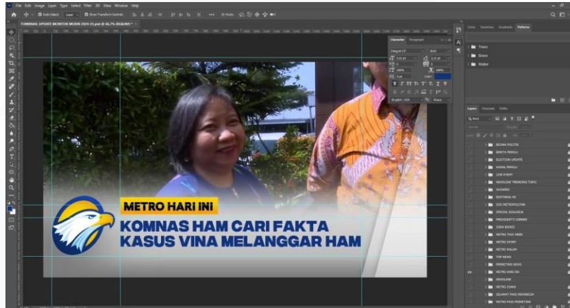
Gambar 3.3 Proses Pembuatan Thumbnail Adobe Photoshop