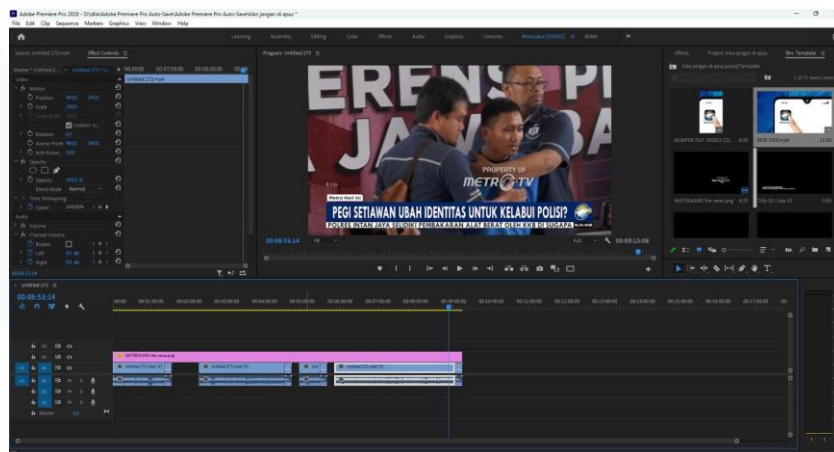
Gambar 3.2 Proses Editing Adobe Premier Pro

Sebelum diunggah, ada beberapa tahap yang harus dilakukan yaitu, melakukan editing video, membuat thumbnail atau lembar cover, dan membuat deskripsi untuk video tersebut. Sebelum di unggah, harus dipastikan bahwa video tersebut sudah benar dan sesuai mulai dari judul, deskripsi dan lembar cover atau Thumbnail .