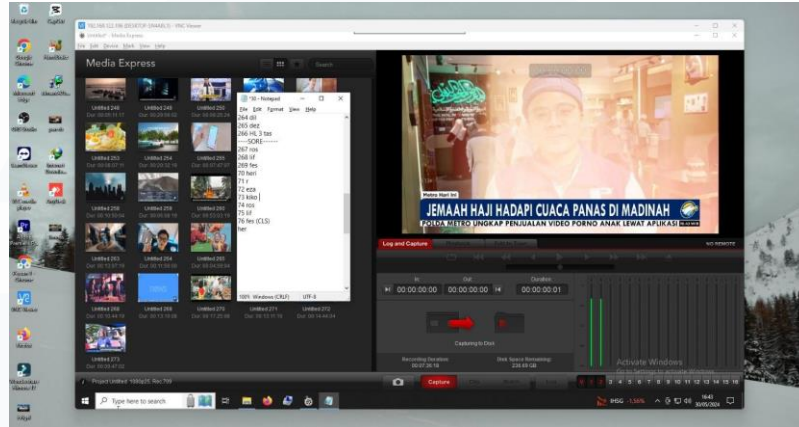
Gambar 3.1 Aplikasi VNC Untuk Bahan Editing dan Urutan Pekerjaan