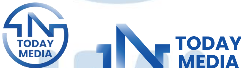
Gambar 2.1 Logo IN Today Media