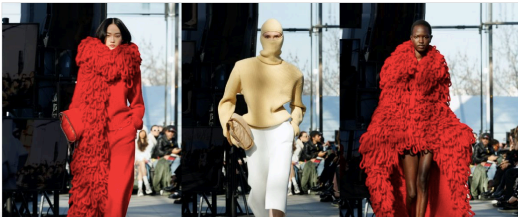
Gambar 2.2 Tangkapan Layar Halaman utama laman web Luxina.id

— The 1st Luxury Platform in Indonesia —