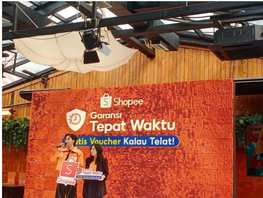
Gambar 3. 3 Dokumentasi liputan lapangan Shopee GTW

Melalui hasil observasi dari pemaparan penjelasan mengenai fitur Garansi Tepat Waktu yang di-launching oleh Shopee, penulis juga dapat memaparkan penjelasan mengenai bagaimana cara masyarakat dapat memperoleh garansi tepat waktu ketika pesanan Masyarakat terlambat datang sesuai dengan tanggal seharusnya pesanan tiba.