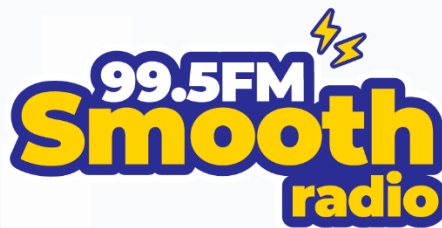
Logo Smooth Radio