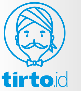
Gambar 2. 1 Gambar Logo Tirto.id

Dalam bahasa Jawa, nama Tirto berarti air. Semua yang hidup di bumi ini membutuhkan air, tidak terkecuali manusia. Oleh sebab itu, Tirto.id ingin memiliki sifat mengalir dan menjernihkan. Layaknya air, Tirto.id terinspirasi untuk bergerak mengisi wadah kosong dan menjadi adaptif. Tulisan-tulisan yang dihasilkan Tirto.id harus mengalir memenuhi ruang baca, dapat dinikmati dalam suasana apapun, menyegarkan, dan memberikan pengetahuan lebih kepada para pembacanya (Manifesto Tirto.id, n.d.).