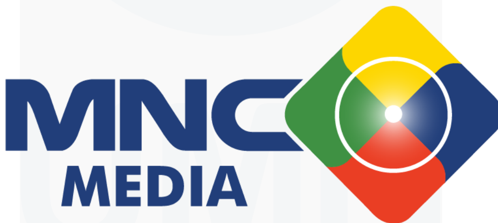
Gambar 2.1 Logo MNC Media

PT Media Nusantara Citra Tbk, yang didirikan pada 17 Juni 1997, merupakan perusahaan terkemuka di bidang media, periklanan, dan produksi konten di Asia Tenggara. MNC Group didirikan oleh Hary Tanoesoedibjo pada tahun 1989 adalah induk perusahaan dari MNC Media. MNC Media sendiri merupakan salah satu anak perusahaan terbesar di bawah naungan MNC Group. MNC Media mengoperasikan beberapa saluran televisi terkemuka di Indonesia yaitu, RCTI, MNC TV, GTV, dan INEWS. Selain itu, MNC Vision, yang dimiliki oleh MNC Media, adalah perusahaan penyedia televisi berlangganan satelit yang didirikan pada tahun 1998, yang juga mengoperasikan Indovision sejak tahun 2006. MNC Media juga terus berkembang dengan meluncurkan saluran-saluran baru, seperti MNC Entertainment dan MNC News, yang dapat disaksikan melalui Indovision. MNC Channels , sebagai bagian dari PT Media Citra Nusantara, merupakan salah satu unit bisnis MNC Media yang berfokus pada televisi berbayar di Indonesia.