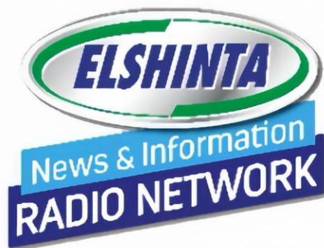
Gambar 2.1 Logo Radio Elshinta