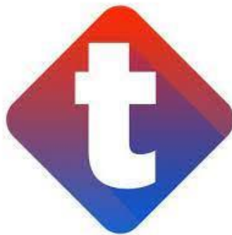
Gambar 2.2 Logo Radio Trijaya FM

Gambar diatas adalah logo yang digunakan untuk seluruh sosial media milik MNC Trijaya FM. MNC Trijaya memiliki akun media sosial untuk membantu mempromosikan program di radionya. Selain itu, media sosial tersebut dipakai untuk menyediakan program-program baru berupa program digital seperti Instagram, Twitter, Facebook, TikTok dan YouTube