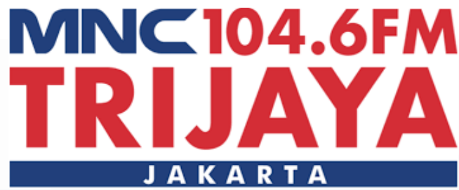
Gambar 2.1 Logo Radio Trijaya FM