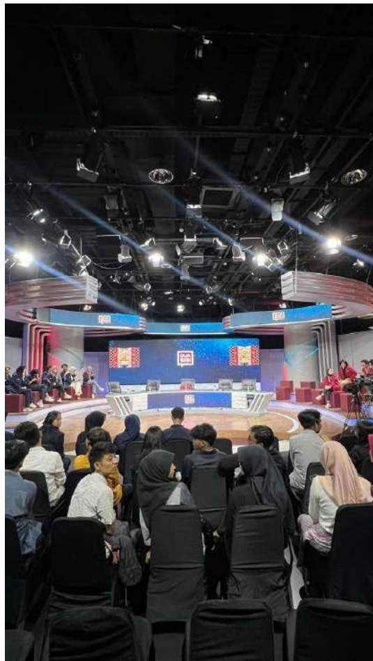
Gambar 3.8 venue dua sisi

Selain itu, penulis juga bertanggung jawab untuk melakukan pengecekan terhadap venue acara sebelum dimulainya siaran. Tugas ini melibatkan pemeriksaan terhadap aspek teknis seperti pencahayaan, mikrofon narasumber, ketersediaan minuman, dan penempatan kursi narasumber. Hasil dari konfirmasi tersebut kemudian dilaporkan kepada eksekutif produser sebagai bagian dari persiapan keseluruhan acara.