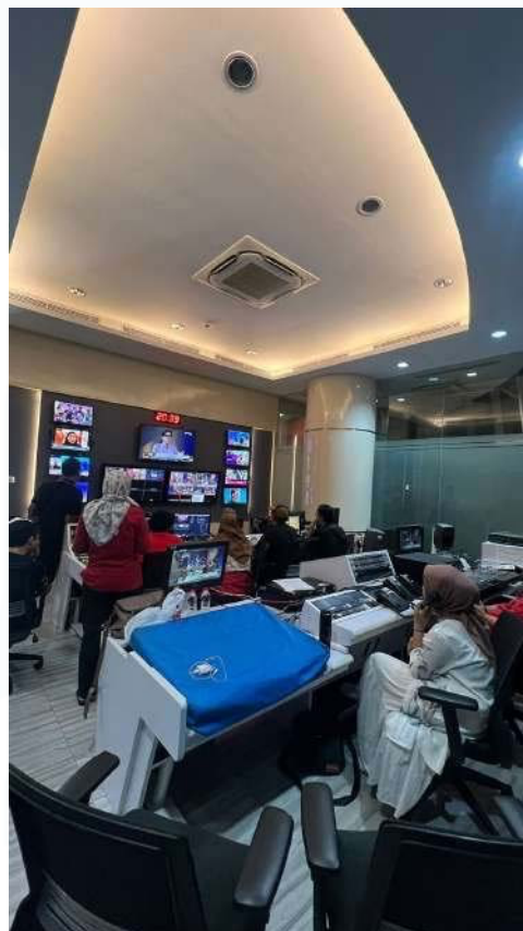
Gambar 3.3 Penulis menjadi TimeCode acara

pertanyaan yang diajukan oleh presenter. Informasi dan momen-momen penting ini kemudian diolah dan disiapkan untuk diunggah ke platform TikTok resmi acara, yaitu @oneononetvone_. Selain tugas-tugas tersebut, penulis juga baru-baru ini diberikan tanggung jawab tambahan untuk menjadi TimeCode yang menghubungkan antara ruang panel dan MCR ( Master Control Room ). Fungsi TimeCode ini penting untuk memastikan koordinasi waktu yang akurat antara berbagai elemen produksi, termasuk waktu combreak dan waktu siaran langsung yang harus diikuti secara ketat. Sebagai TimeCode , penulis bertanggung jawab untuk memberikan informasi yang tepat waktu kepada tim produksi, sehingga mereka dapat mengatur jeda iklan dan memulai siaran. langsung sesuai jadwal yang telah ditentukan.