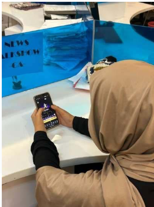
Gambar 3.5 penulis mengedit video narasumber