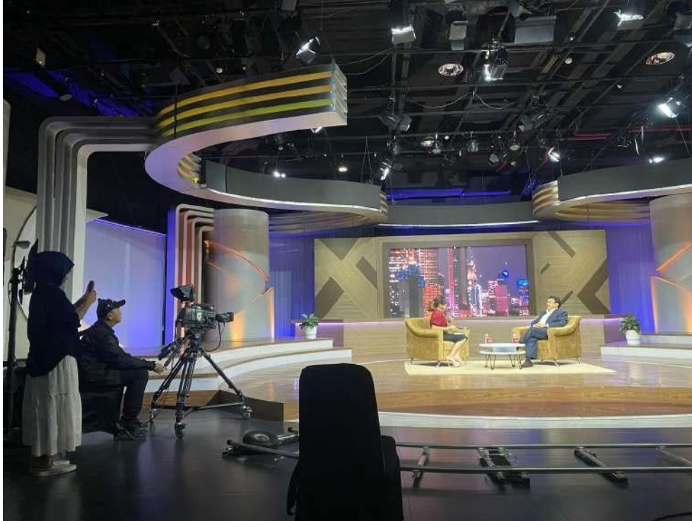
Gambar 3.4 penulis mendokumentasi narasumber