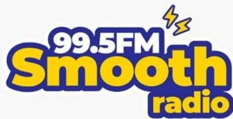
Logo Smooth Radio