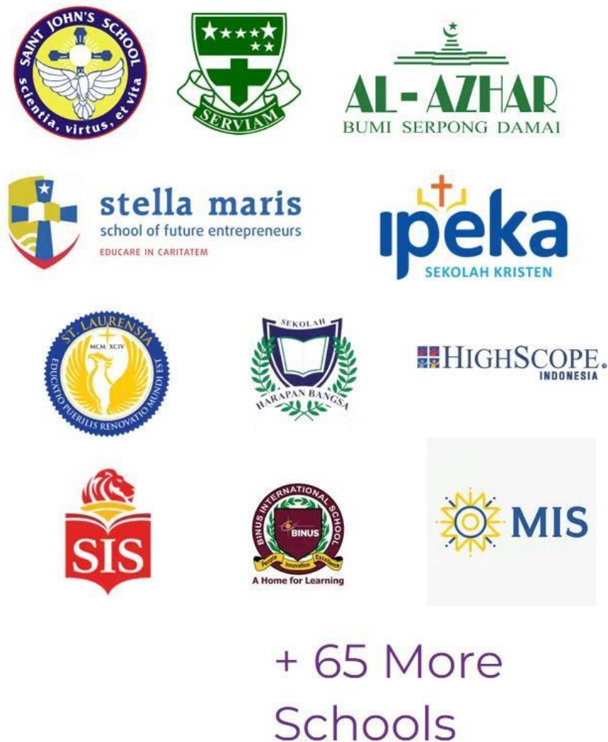
Gambar 2. 3 Sekolah yang bekerja sama dengan pihak Digikidz