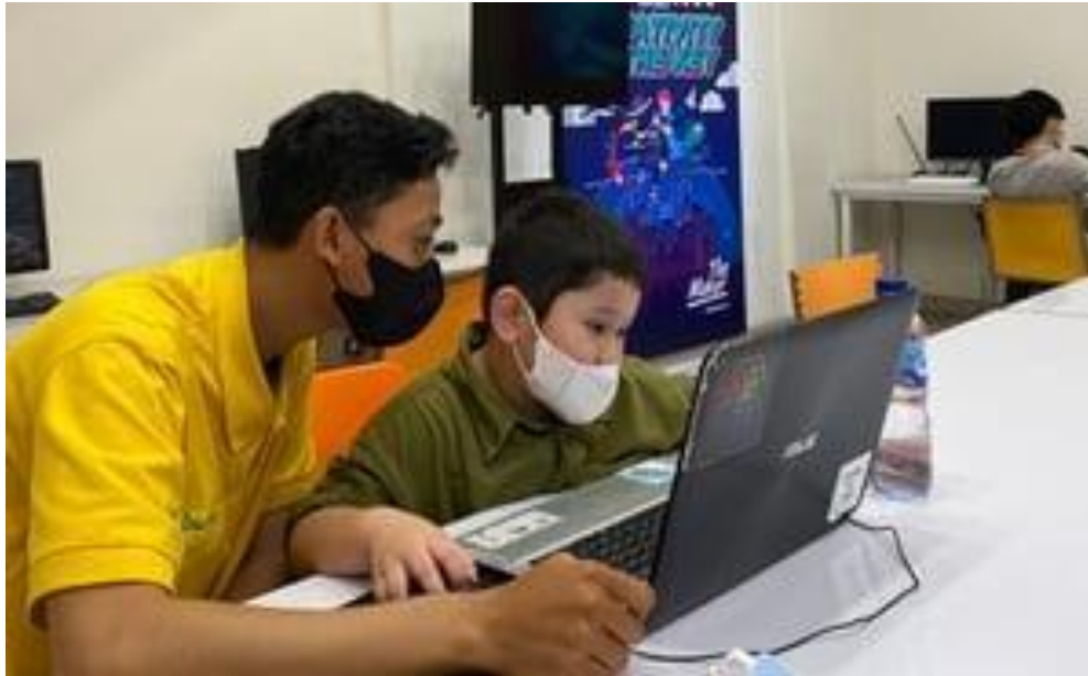
Gambar 2. 2 Proses coaching Digikidz

Perusahaan terus berkembang dan melakukan ekspansi ke Sumatera pada tahun 2017, membuka cabang di Bandar Lampung, Palembang, Jambi, dan Medan. Pada tahun 2019, melalui 14 cabang dan lebih dari 80 sekolah yang telah bekerjasama, Digikidz membuat brand baru berbasis coding & robotic . Situasi pandemi pada tahun 2020 membuat perusahaan beralih ke pembelajaran online untuk kelas dan operasionalnya.