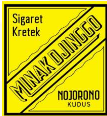
Gambar 2. 2 Minak Djinggo

Minak Djinggo yang diluncurkan sejak tahun 1932 merupakan pelopor inovasi sigaret kretek tangan (SKT) yang dilengkapi dengan paraffin pada bagian hisapan (tipping). Minak Djinggo bertahan di industri SKT selama lebih dari delapan puluh delapan tahun.