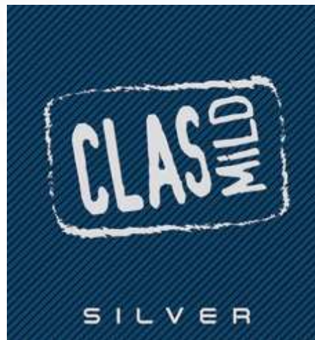
Gambar 2. 4 Clas Mild Silver

Bentuk varian lainnya dari kategori SKMM yang diluncurkan pada tahun 2019. Clas Mild Silver memberikan rasa halus dan nikmat dengan tembakau dan cengkeh pilihan terbaik.