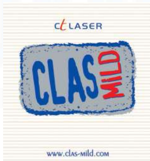
Gambar 2. 3 Clas Mild