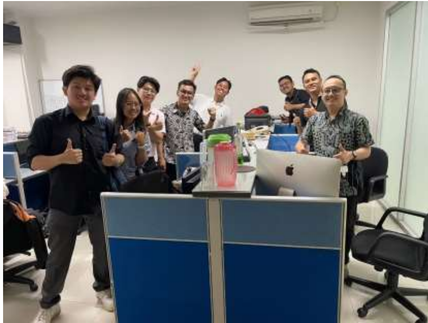
Gambar 2. 10 Team IT

Berikut ini adalah foto dengan Team IT PT.Nojorono Tobacco International, foto ini diambil sebagai momen kenangan magang bersama team IT yang sangat luar biasa ini, saya banyak belajar lebih dari sekedar teknologi, tapi juga tentang kerja sama, dan bagaimana kenyataan kerja didunia IT, Terimakasih untuk semuanya yang telah memberikan pengalaman yang sangat berharga dan memberikan banyak hal yang banyak saya pelajari selama magang berlangsung, Terimakasih juga untuk semuanya yang secara tidak langsung menjadi mentor saya selama magang diperusahaan ini.