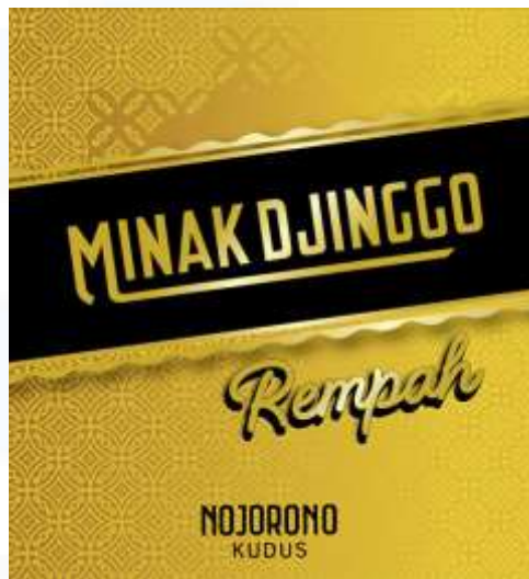
Gambar 2. 5 Minak Djinggo Rempah

Di tahun 2020, pemikiran akan lahirnya produk baru di tengah pandemic menjadi salah satu upaya Nojorono dalam menjamin keberlangsungan lapangan kerja dan terus Bergeraknya roda ekonomi masyarakat.