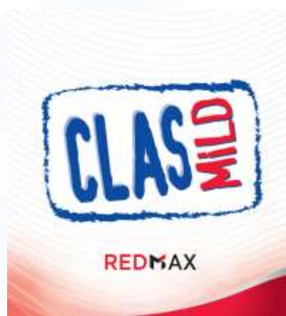
Gambar 2. 6 Clas Mild Redmax

Bentuk varian lainnya dari kategori SKMM yang diluncurkan pada tahun 2021. Clas Mild RedMax memberikan rasa yang lebih mantap dan nikmat dengan tembakau dan cengkeh pilihan terbaik.