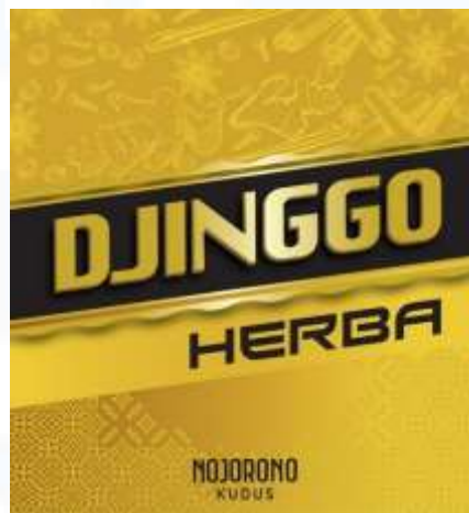
Gambar 2. 8 Djinggo Herba

Terinspirasi dari warisan cita rasa khas Minak Djinggo selaku pelopor kretek ikonik dengan bahan baku tembakau dan cengkeh pilihan terbaik yang diracik apik dengan beragam herba segar dan gurih. Djinggo Herba menyuguhkan cita rasa halus yang cocok memenuhi selera dewasa muda.