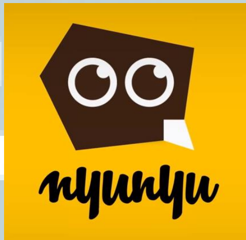
Gambar 2.2. Logo Perusahaan