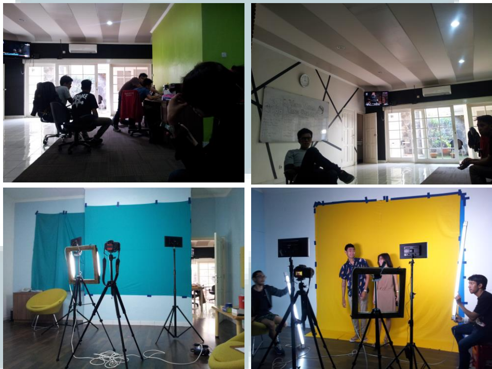
Gambar 2.1. Situasi Kantor

PT. Nyunyu Digital Media adalah sebuah badan usaha kreatif di Indonesia dalam bidang website dengan unsur komedi dan remaja. baik dari segi proses pembuatan maupun penyajian kepada para pembacanya. Website yang dihasilkan oleh perusahaan ini adalah website untuk menghibur para pembacanya dan sudah sangat terkenal di Indonesia dan hampir setiap harinya selalu di hit banyak orang karena artikel-artikelnya yang menarik. Tidak perlu susah lagi untuk dikenal karena co-founder perusahaan ini adalah Raditya Dika dan Arief Muhammad yang bisa di bilang sudah sangat dikenal oleh para remaja.