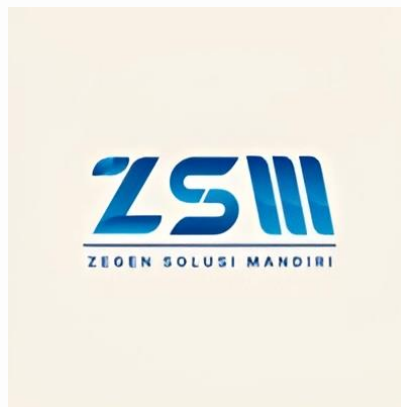
Gambar 2.1 Logo PT Zegen Solusi Mandiri

PT Zegen Solusi Mandiri berdiri pada tanggal 15 November 2019 dan saat ini berlokasi di Alam Sutera, Tangerang. Perusahaan ini bergerak di bidang IT Service & Consultant untuk berbagai industri, namun berfokus pada klien dengan sektor perbankan. Tagline dari PT Zegen Solusi Mandiri sendiri adalah I.D.E.A.L dengan arti ' Integrity, Dedication, and Loyalty '. PT Zegen Solusi Mandiri juga menawarkan berbagai produk solusi perangkat lunak umum yang mampu mengatasi permasalahan bisnis serta memenuhi kebutuhan klien yang beragam. Beberapa produk yang dimaksud meliputi CRMTrack, SmartRecon, VayuPro, dan lain-lain. Beberapa klien dari PT Zegen Solusi Mandiri adalah Maitrend School dengan penggunaan Learning Management System (LMS) bernama LearnRight, PT. Rintis Sejahtera dengan CRMTrack, dan Bank BTN dengan pengembangan software in-house bernama BTN SMART.