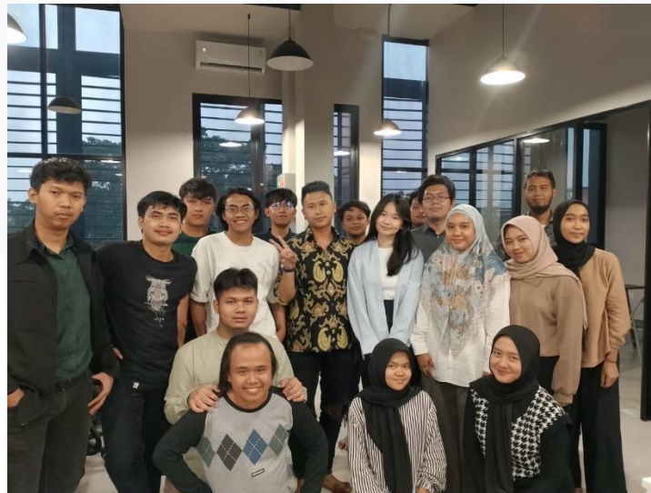
Gambar 2.2 Foto Peserta Magang dan Pegawai PT Zegen Solusi Mandiri

dari yang semula adalah suatu entitas kecil hingga menjadi salah satu perusahaan IT consultant terkemuka di Indonesia saat ini. Huruf Z, S, dan M yang terpisah membentuk mata, sayap, dan sisik naga guna memberikan kesan keberanian, kehebatan, dan prestasi yang melegenda. Perusahaan juga mengadopsi simbolisme naga sebagai legenda, dimana walaupun belum semua orang pernah melihat naga secara langsung, namun tetap mendengar dan mengetahui keberadaan naga melalui berbagai cerita dan legenda yang tersebar luas.