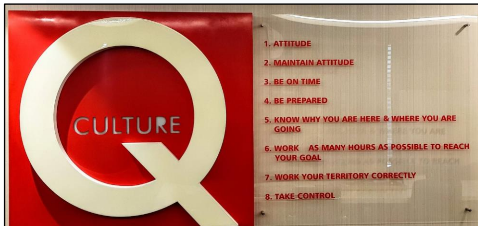
Gambar 2.2 Eight Culture di Q Corp Indonesia